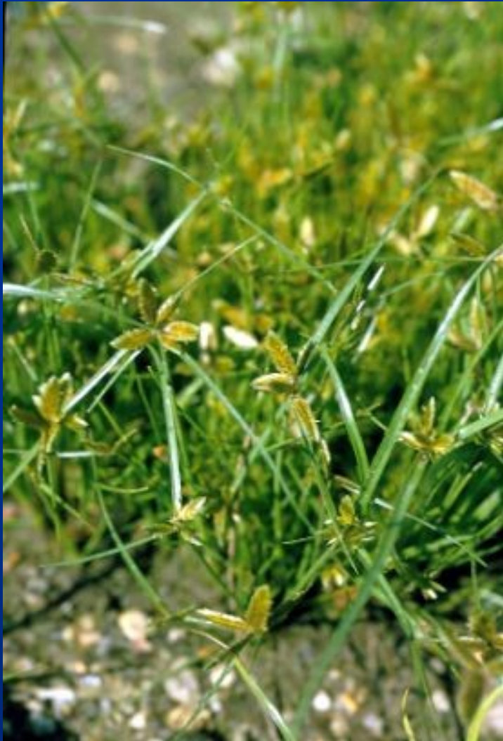
Šáchorek (šáchor) žlutavý – Pycneus (Cyperus) flavescens