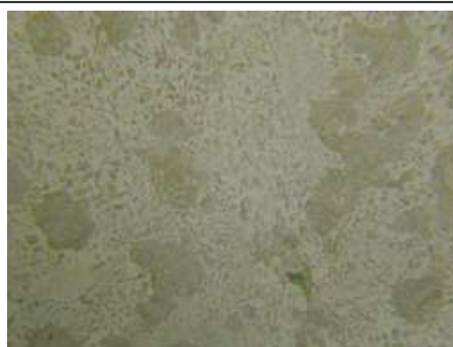
OBR. 3.: Mikrostruktura nadeutektické slitiny Pb-86wt%Sn po ochlazení na laboratorní teplotu. Tmavé větší oblasti jsou zrna fáze bohaté na Sn, zbytek je dvoufázové eutektikum.

KALIBRACE TERMOČLÁNKU NA ZNÁMÉ FÁZOVÉ TRANSFORMACE: Použijeme tabelované teploty vhodných fázových transformací (např. tání Pb, Sn, PbSn-eutektika, tání jiných čistých kovů, bod varu vody, tání ledu) a vhodným experimentem změříme napětí vykazované používaným termočlánkem nejméně pro dvě teplotně odlišné fázové transformace. Z tohoto důvodu je vhodné například využít opakovaného výše uvedeného experimentu s tím, že při měření křivek chladnutí vhodně přehodíme články v kapilárách. Se způsobem kalibrace u použitého měřiče teploty se seznámíme v jeho návodu.