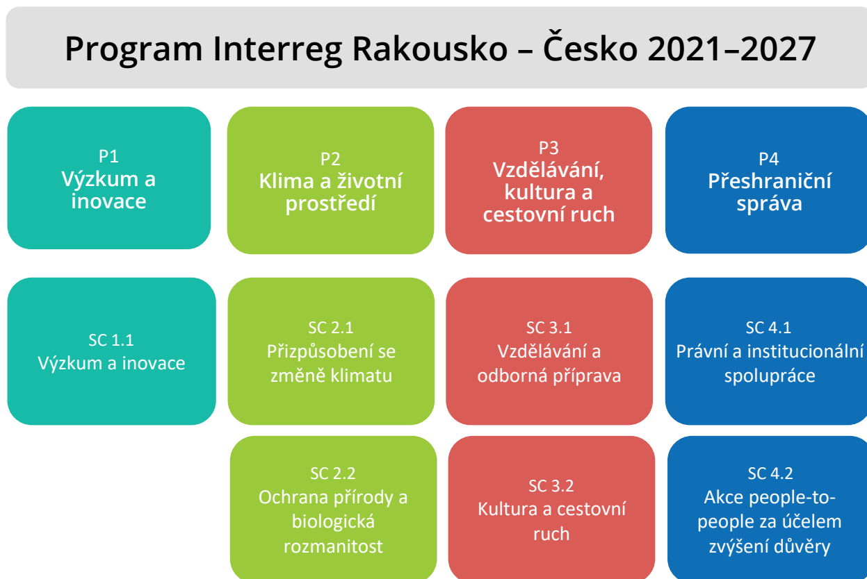
Obrázek 3: Priority a specifické cíle

Program Interreg Rakousko – Česko 2021–2027 podporuje projekty ve čtyřech tematických prioritách (P). Ty jsou dále rozděleny do sedmi specifických cílů (SC):