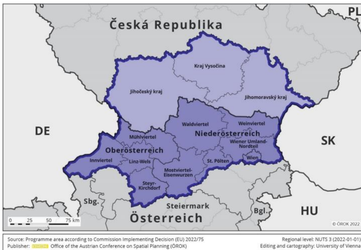
Obrázek 2: Mapa programového území

Pro programové území jsou také relevantní dvě makroregionální strategie (EUMRS): Strategie EU pro Podunají (EUSDR) a Strategie EU pro alpský region (EUSALP). Propojením s EUSDR a EUSALP se docílí většího územního dopadu Programu a realizace kvalitních projektů s optimálním strategickým zaměřením a lepším zviditelněním.