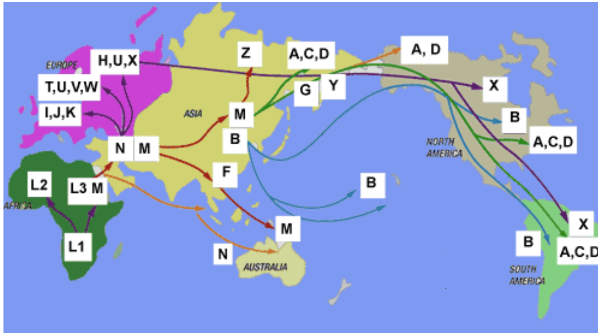
Haploskupiny lidské mitochondriální DNA