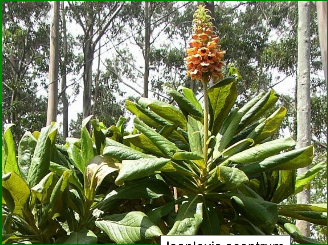
Isoplexis sceptrum www.flora-nikde.cz