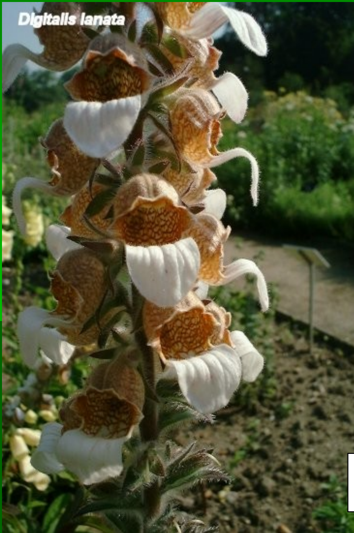
Digitalis lanata www.ispb.univ-lyon.fr