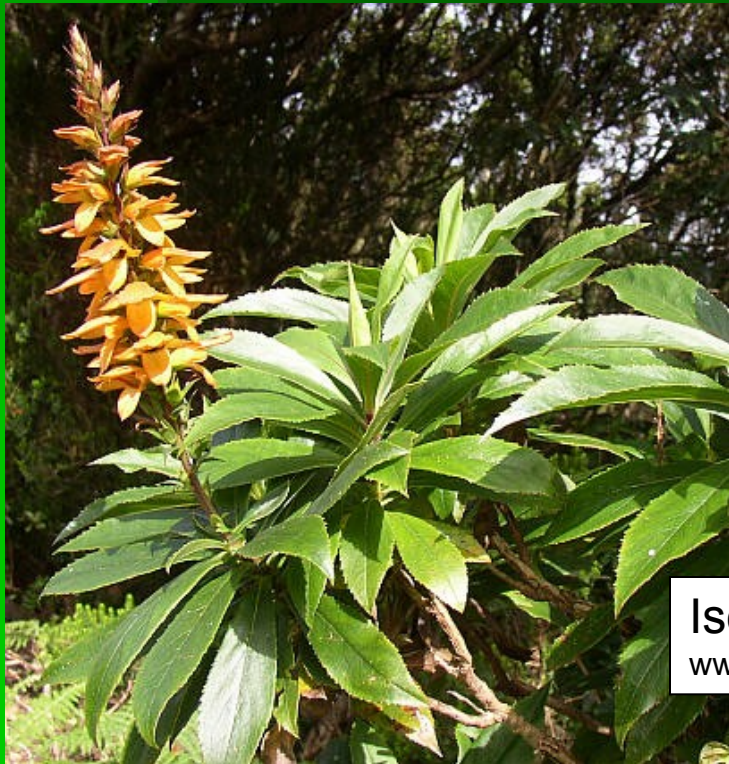
Isoplexis canariensis www.flora-nikde.cz