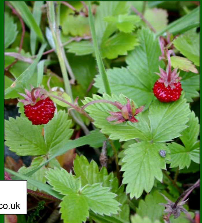
Fragaria vesca