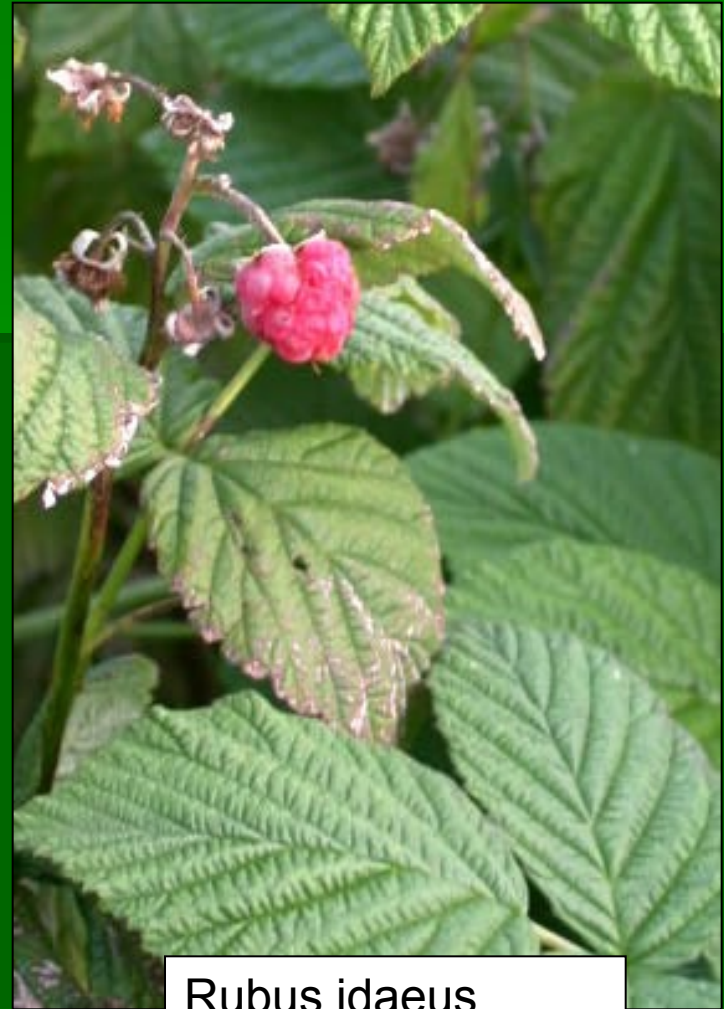
Rubus idaeus