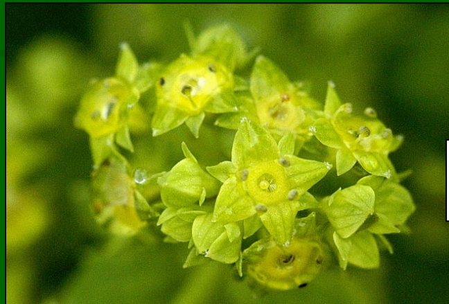
Alchemilla xanthochlora www.popgen.unimaas.nl