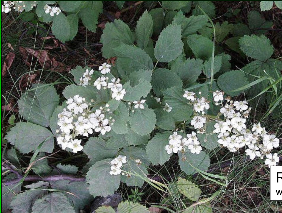
Rubus canescens