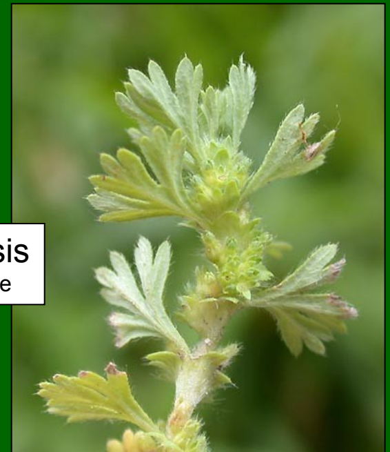
Aphanes arvensis www.ruhr-uni-bochum.de