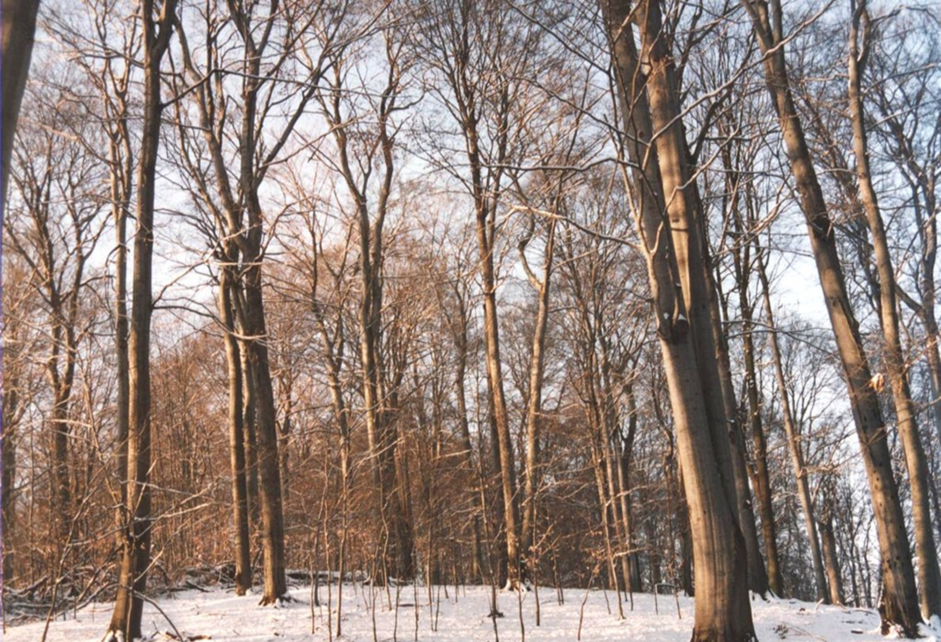
Les zvláštního určení z titulu ochrany přírody – přírodní rezervace (Jelení skok u Vranova u Brna)