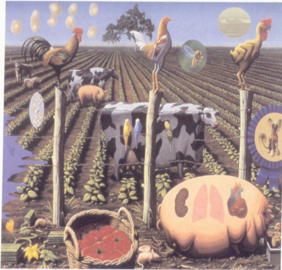
Figure 1.3 The Farm , by Alexis Rockman. According to the artist, “The Farm explores the iconography of agriculture. The Farm is set on a wide-angled field with all its usual trappings—animals, fruits, and vegetable. The situation, however familiar, is far from predictable. A disproportionately enormous and savage cow has an overabundance of teats. The pig is a human organ factory. And the chicken, which