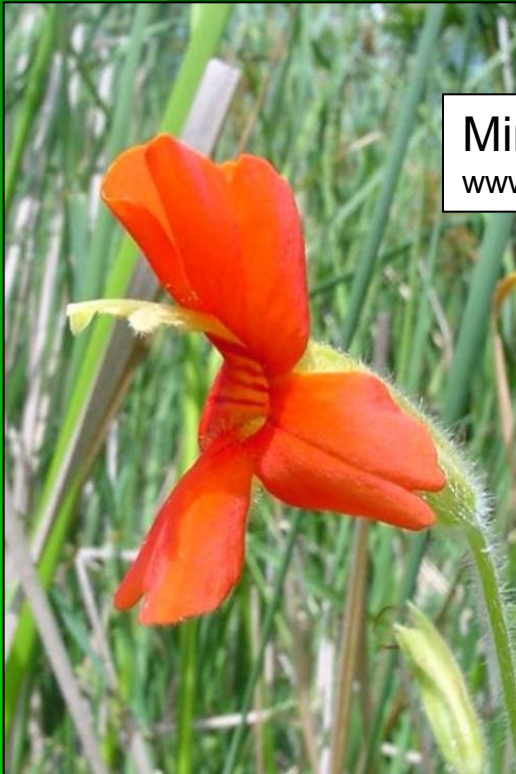
Mimulus cardinalis