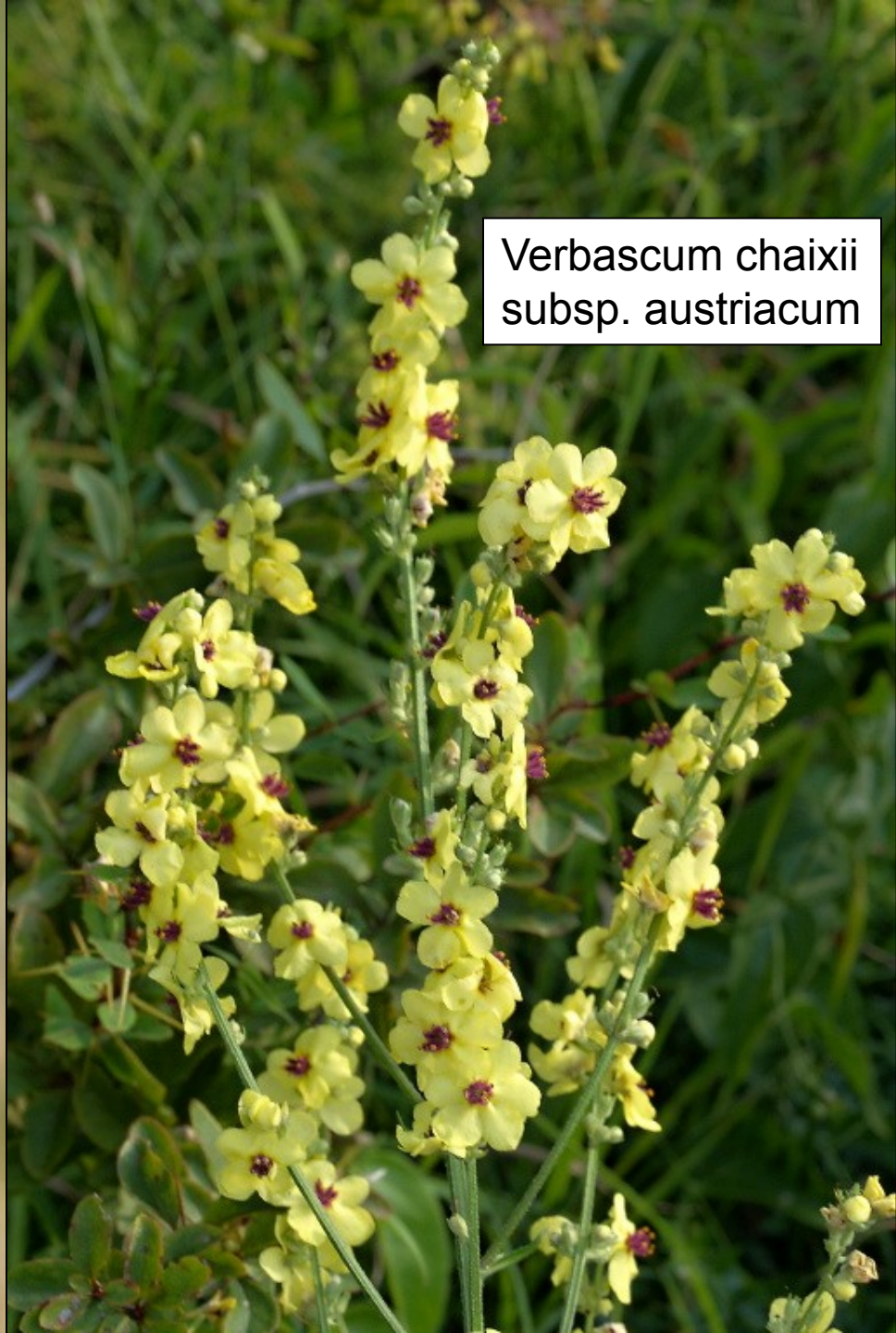
Verbascum chaixii subsp. austriacum