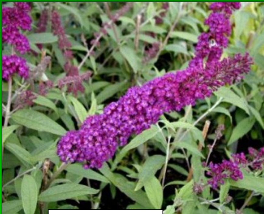
Buddleja davidii