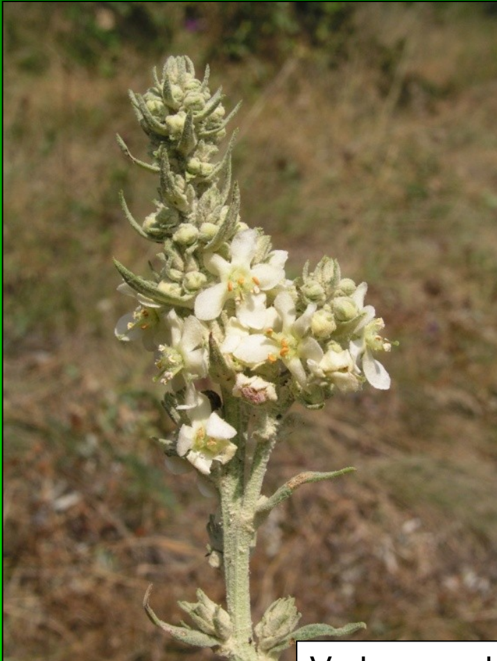
Verbascum lychnitis subsp. moenchii