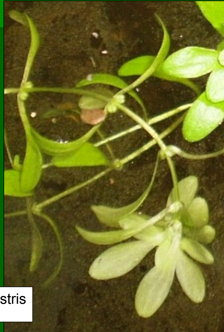
Callitriche palustris www.botany.cz