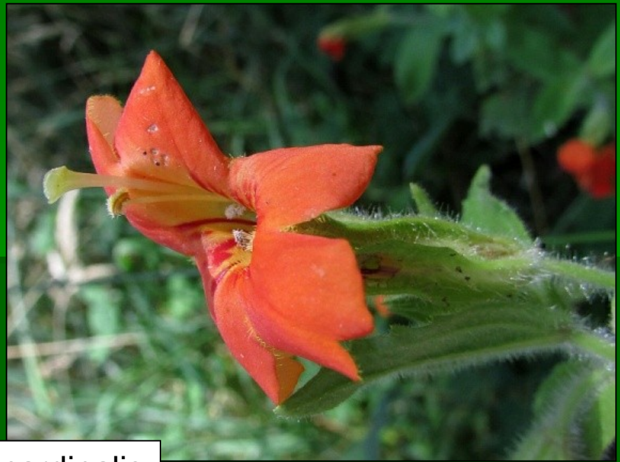
Mimulus cardinalis