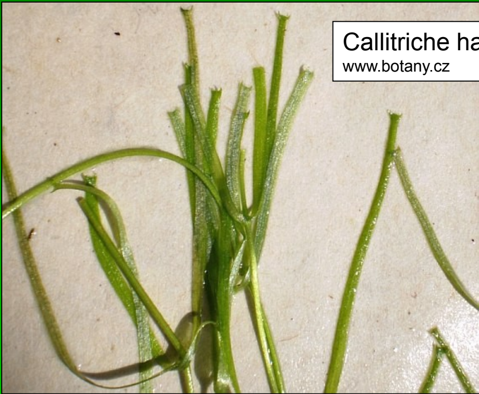
Callitriche hamulata