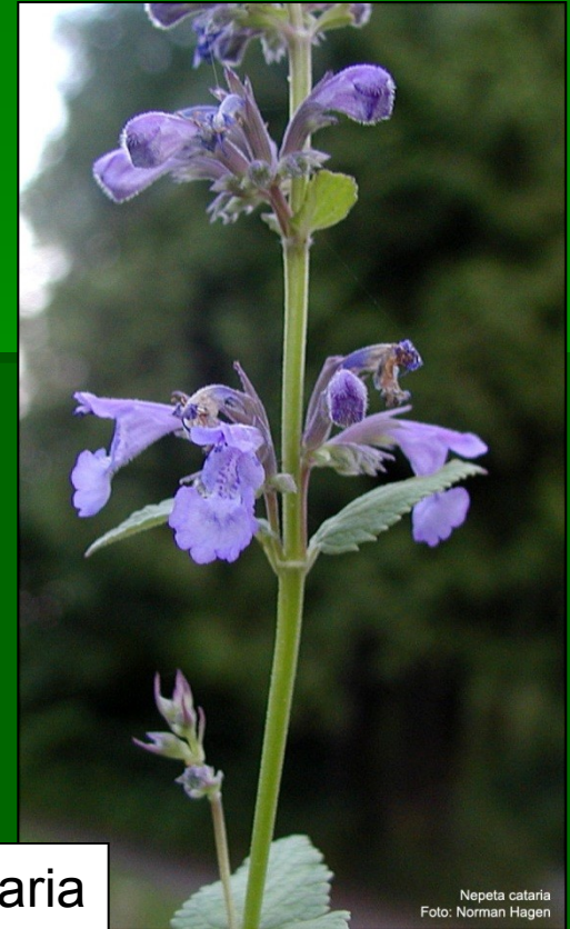
Nepeta cataria www.toyen.uio.no