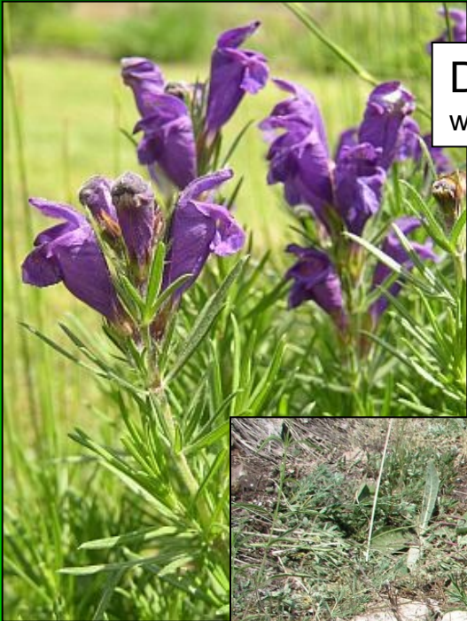
Dracocephalum austriacum www.botany.cz