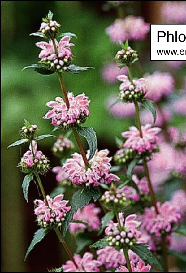
Phlomis tuberosa www.em.ca