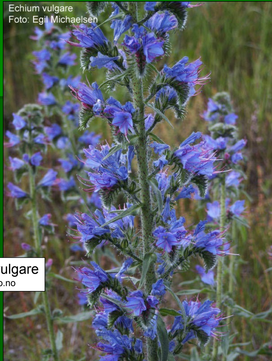
Echium vulgare