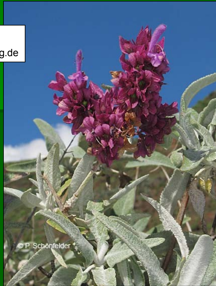
Salvia canariensis www.biologie.uni-regensburg.de