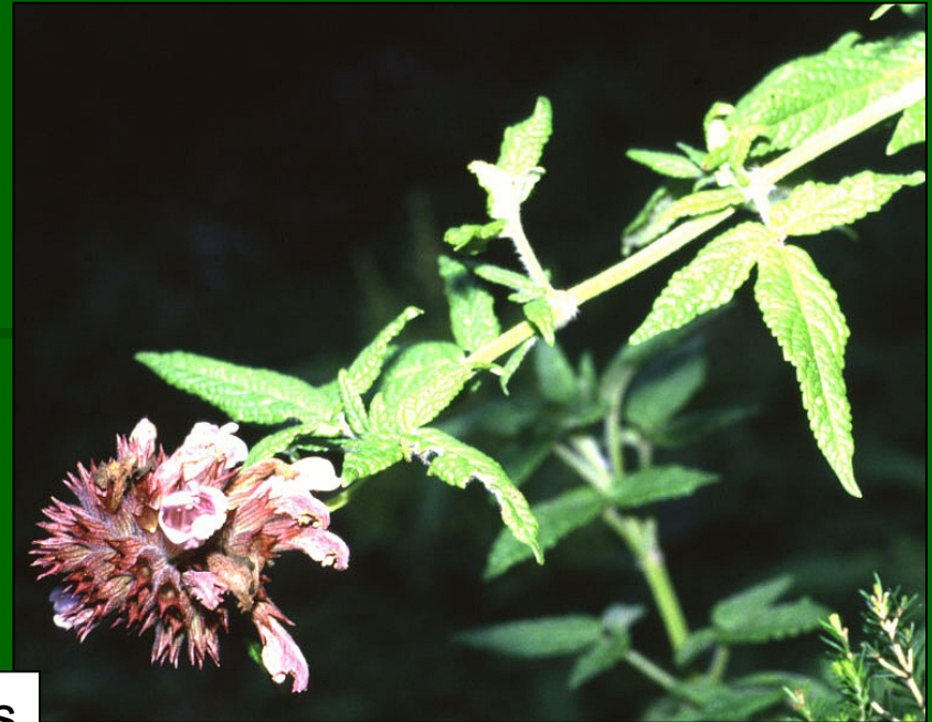
Cedronella canariensis www.botany.cs.tamu.edu