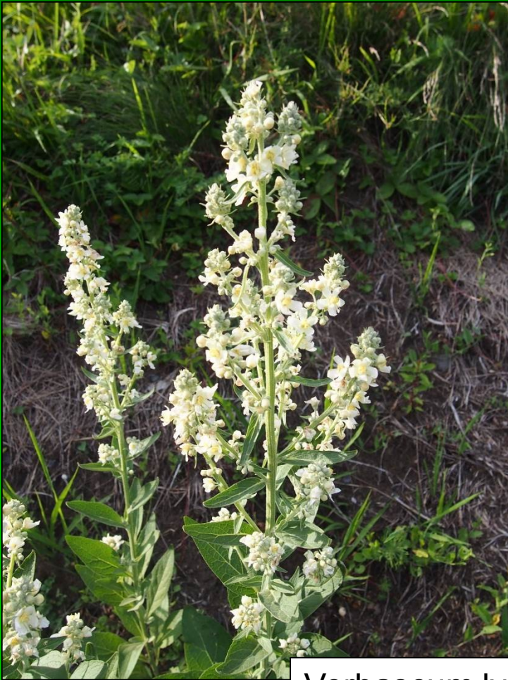
Verbascum lychnitis subsp. moenchii