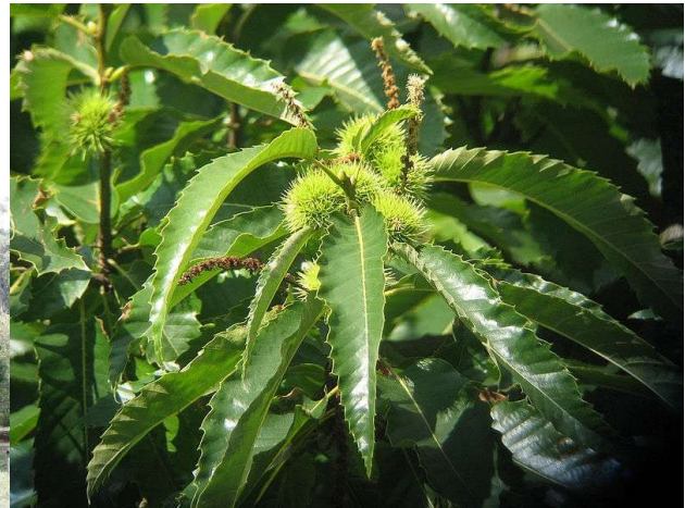
Castanea sativa .