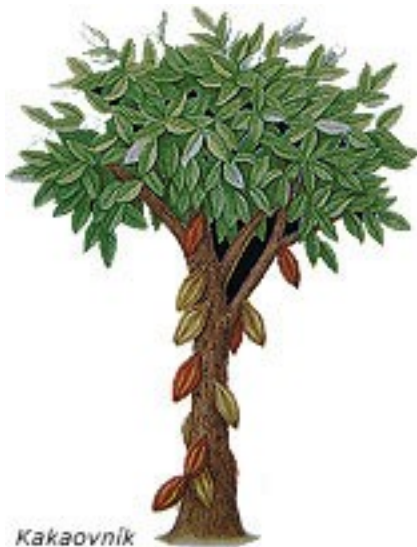
Kakaovník - lat. Theobroma Cacao