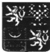
Jan Kubice ministr vnitra

Praha 20. března 2012 Č.j: MV-29670-3/KM-2012 Počet listů: 2