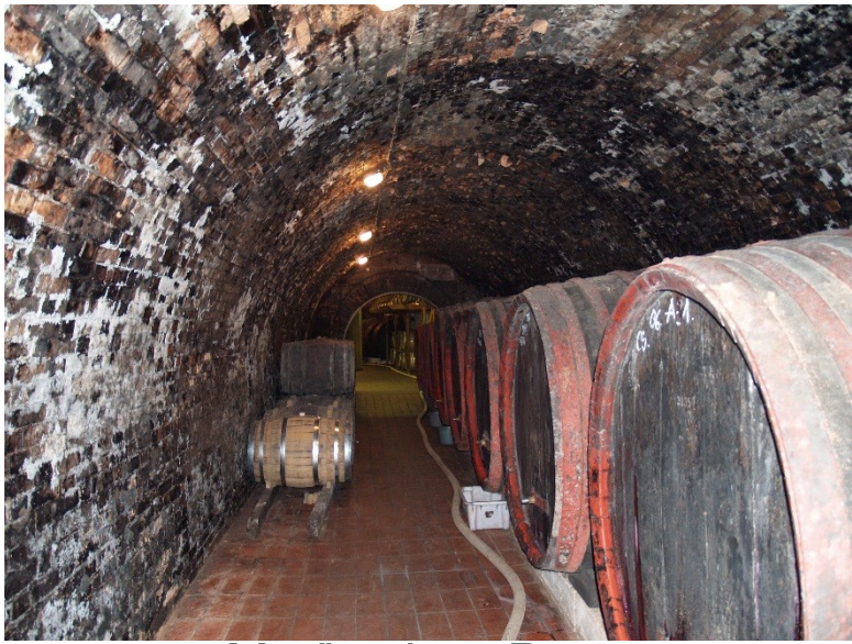
Maďarsko - Pecs