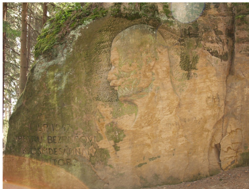
Opatovické hradisko – P. Bezruč

Umělecká díla ve skalních masívech i v podzemí, reliéfu apod.