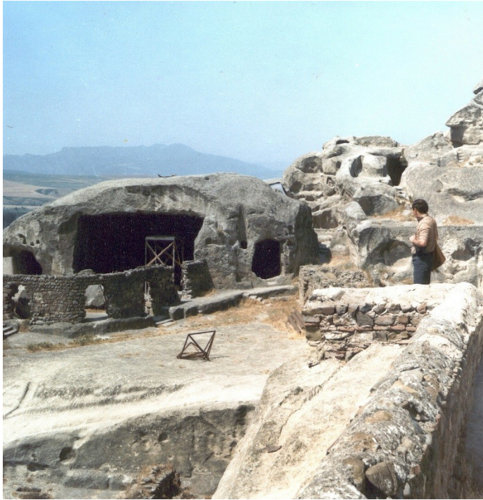
Gruzie – Uplisciche

Podzemní prostory u hradů skalní hrad Sloup, Pařez, soustava vězení hradu Sovince