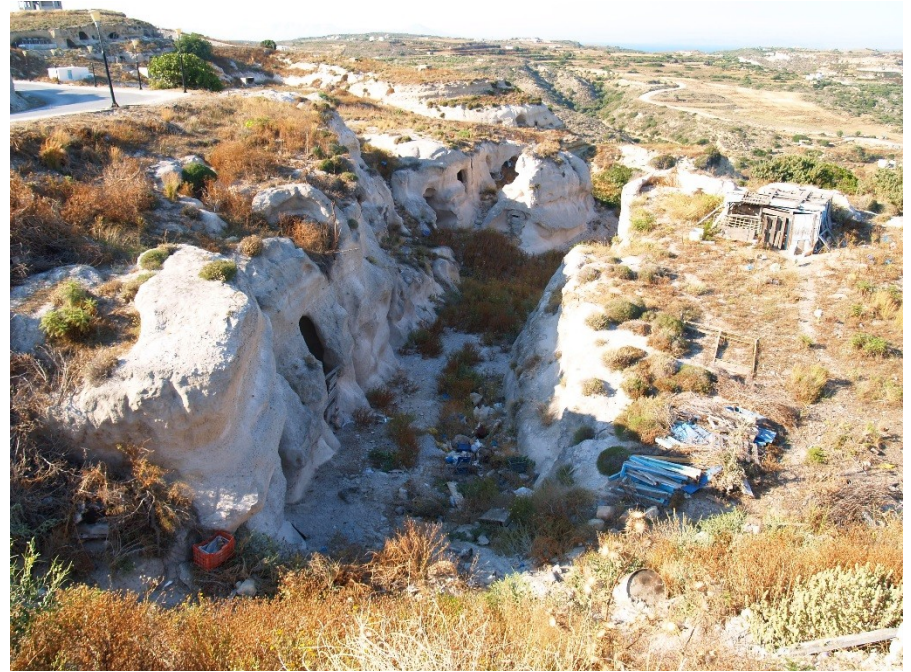
Kos- Kefalos – skalní obydlí