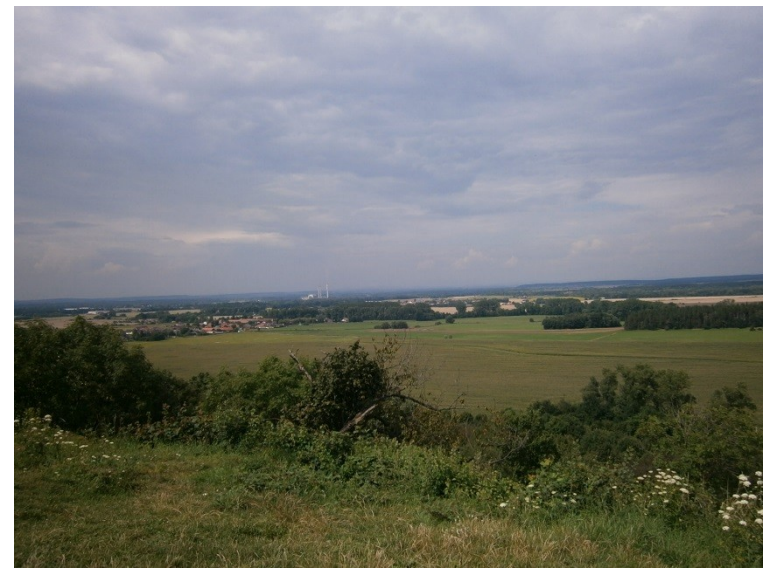
TE Opatovice n. L.