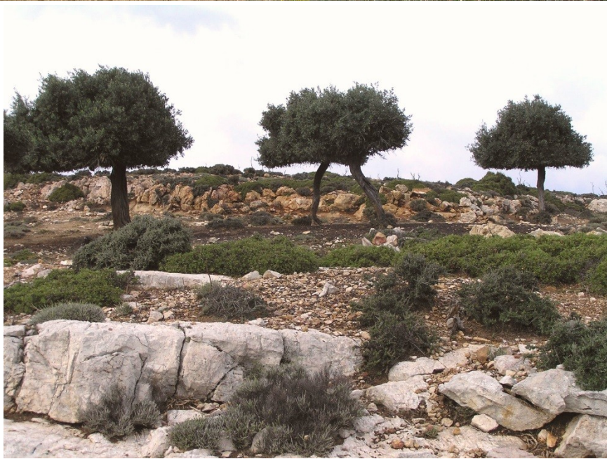
Thasos – Potos