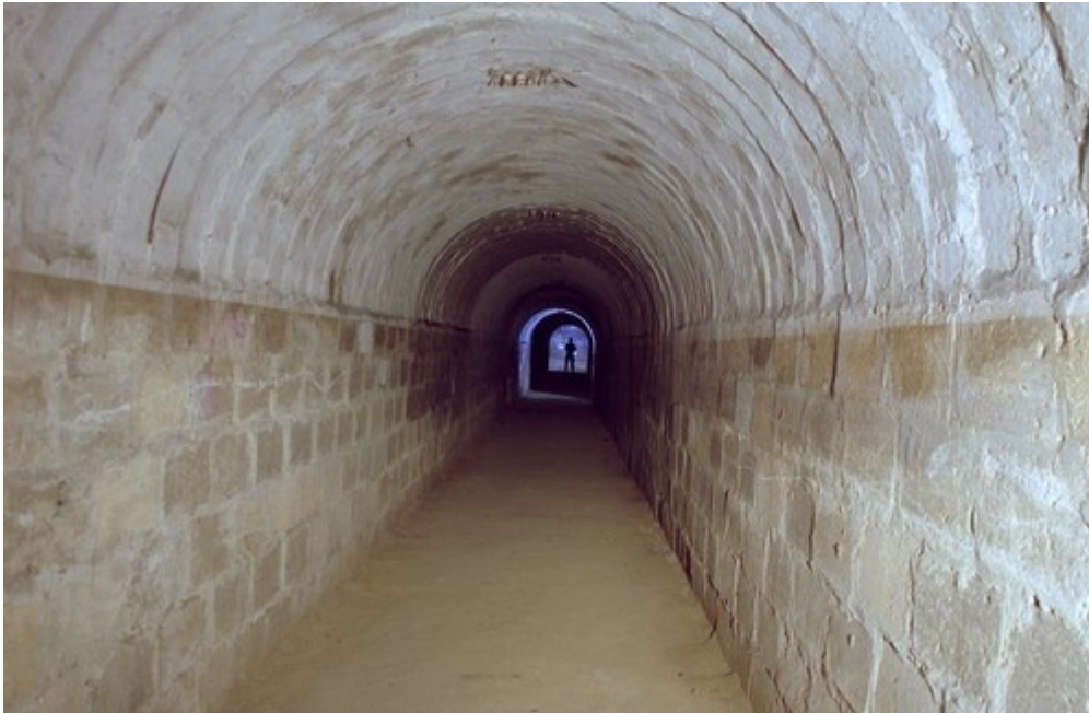
Brno - Kraví hora

Keltské obranné valy, Jablunkovské valy, pozůstatky napoleonských válek na Slavkovsku (Santon – kopec přemodelovaný Francouzi)