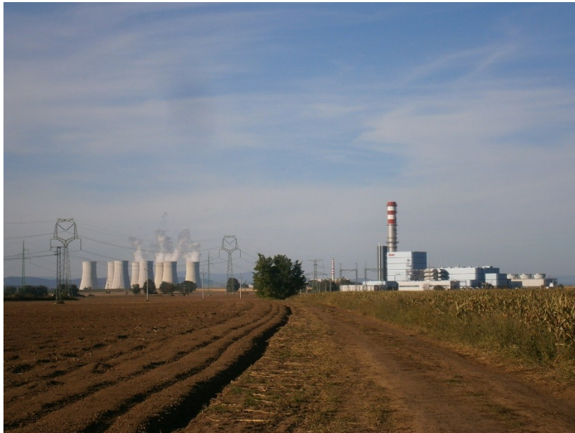
JE Jaslovské Bohunice