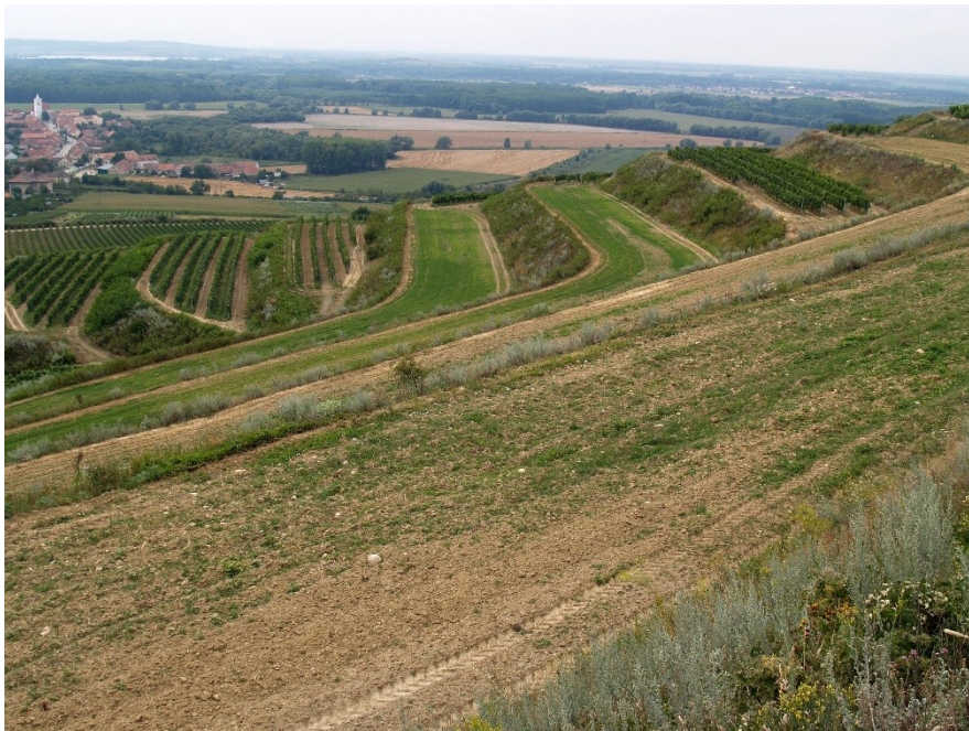
Pouzdřanské kopce – agrární terasy