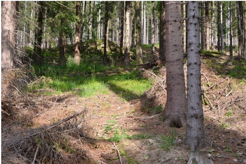
Haldy kamení vysbíraného z polí – Horní Morava