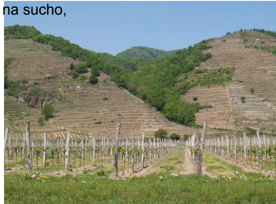
Rakousko – Wachau

Stavěné agrární terasy (budování z kamene na sucho,