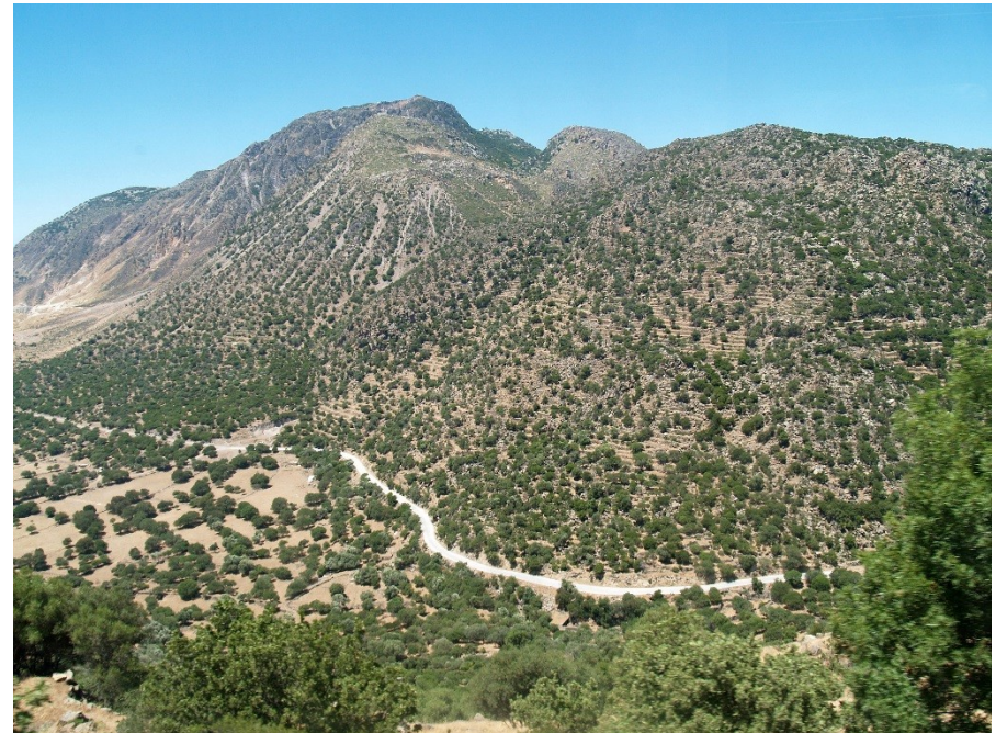
Nysiros – agrární terasy