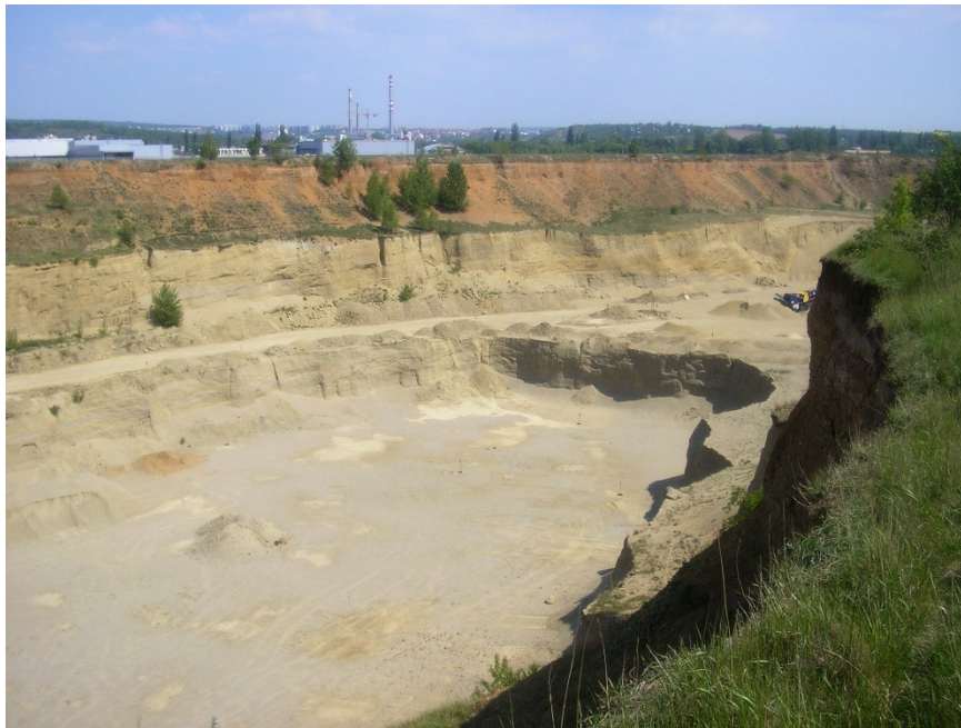
Černovice – pískovna