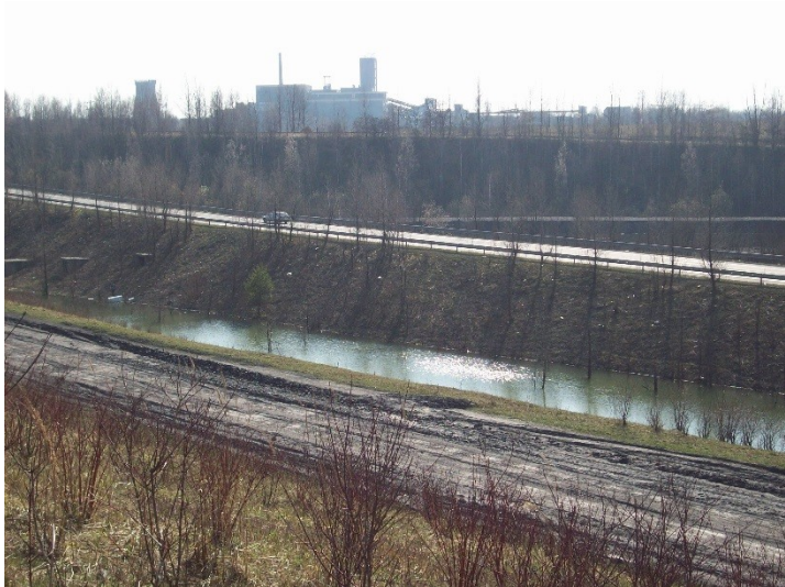
Důl ČSM – poklesy