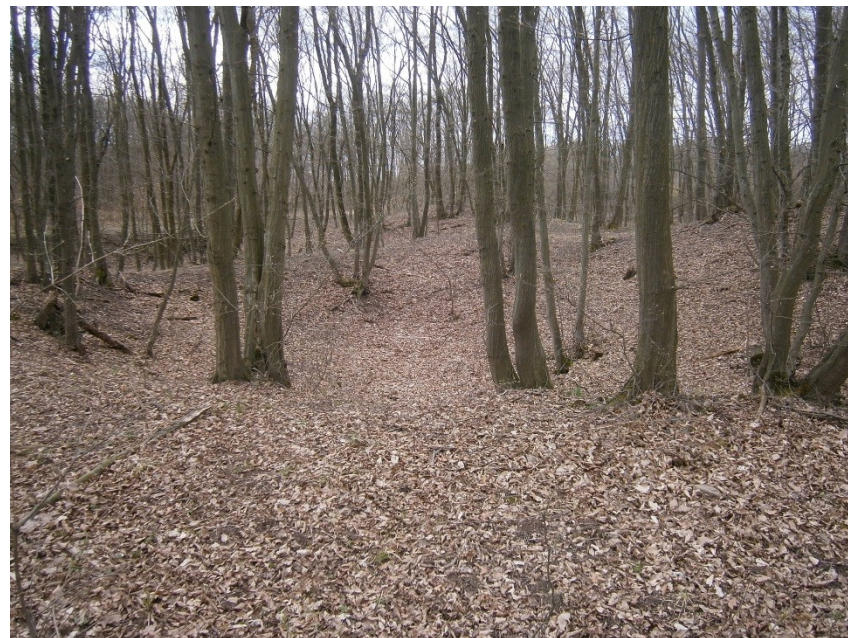
Drobné těžby vápenců v okolí