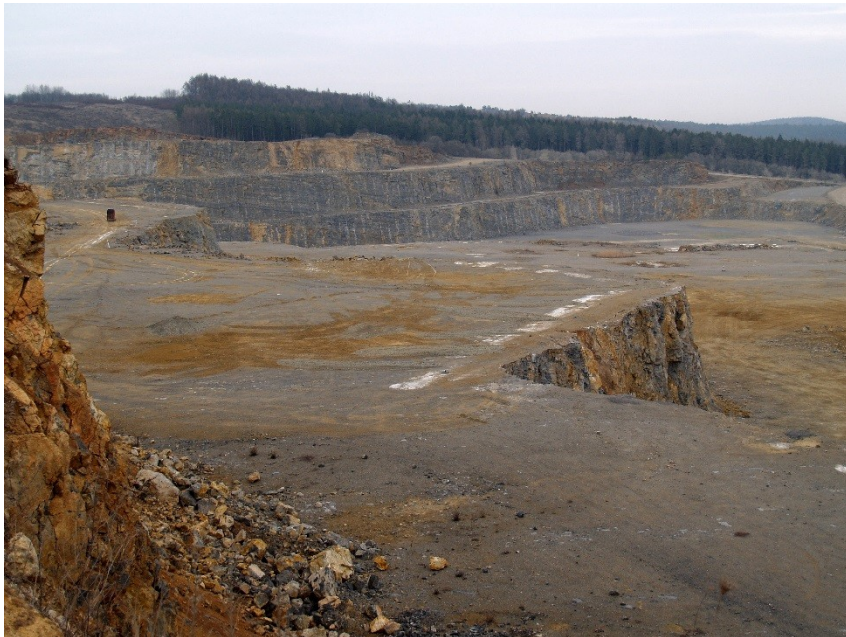
Mokrý – těžba vápence