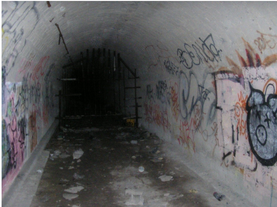
Růženin lom, tunely do ,lomu Džungle