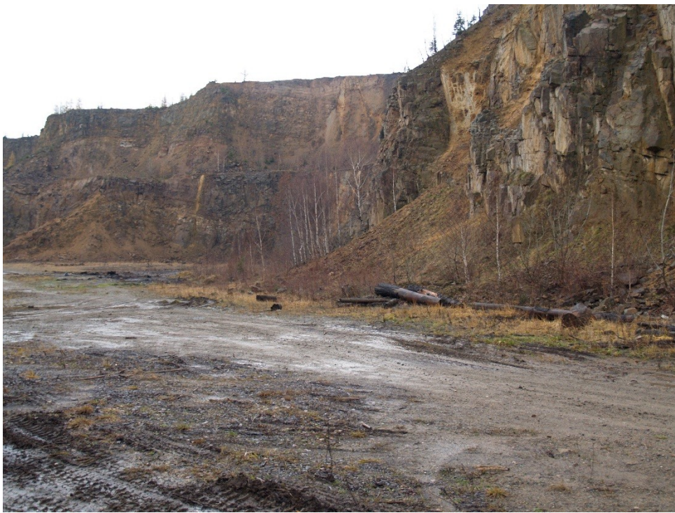
Kamenolom – Bučník, vulkanity