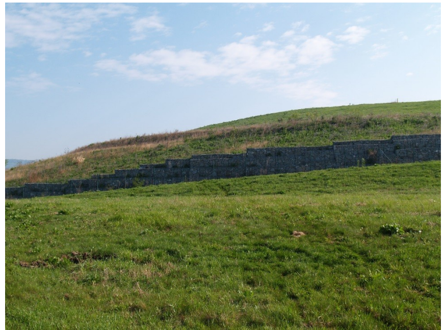
Chabařovice – výsypka, jezero Milada, rekultivace, sesuv