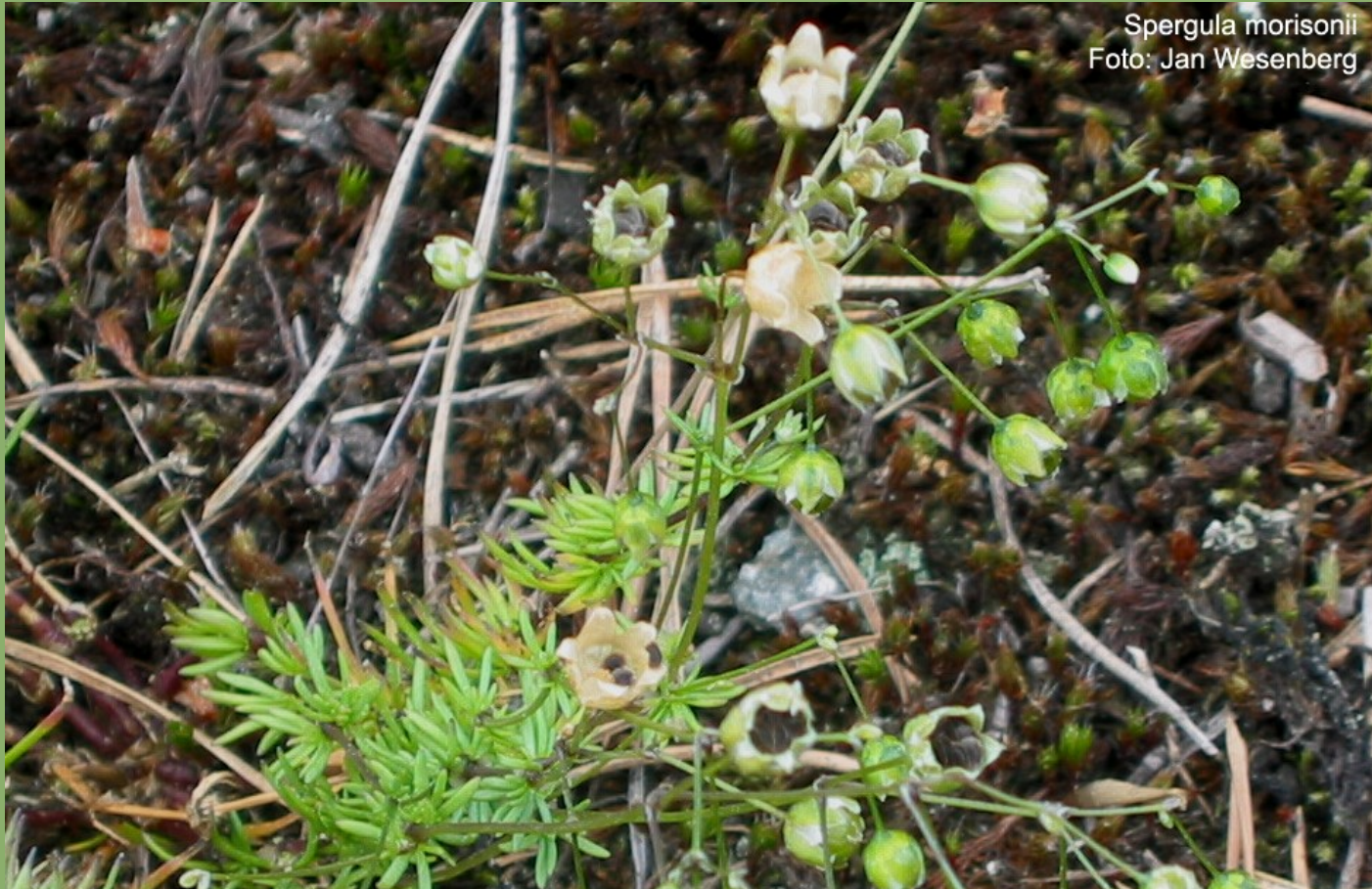
Spergula morisonii