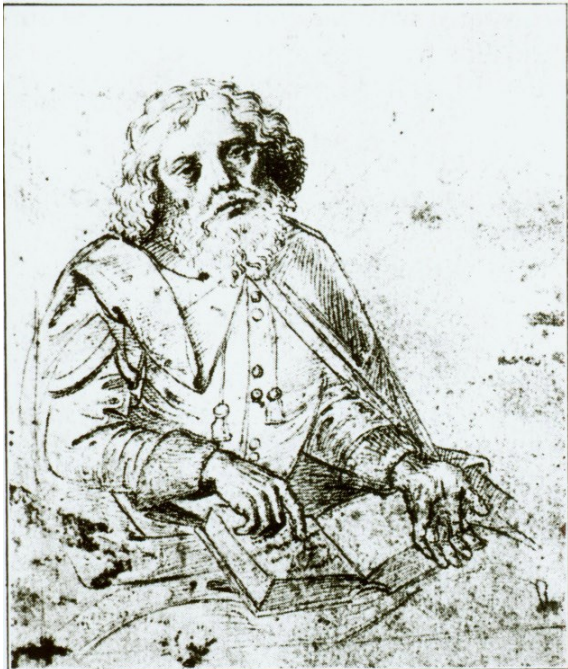
Platón (427–347 př. n. l.)

Mezi další jeho významná díla patří mimo jiné Obrana Sokrata , Gorgias , Protagoras , Symposion , Parmenides , Timaios , Politikos , Zákony a další. (Od začátku 90. let 20. století až do současnosti vycházejí Platónovy spisy v nakladatelství Oikoymenh [dříve ISE], v roce 2003 vyšly sebrané spisy [ Spisy I–V ] v překladu Františka Novotného.)