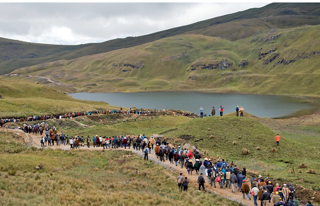
Obr. 1: Březen 2012. Protest místních obyvatel v regionu Cajamarca (Peru) proti povolení těžby zlata v plánovaném dole Conga mine. Těžba by ohrozila zejména zdroje pitné vody pro celou oblast. Kromě plánovaného zničení 20 horských jezer (jedno z nich na obrázku) a systematického odčerpávání podzemní vody hrozí také kontaminace těžkými kovy. Peruánský prezident Ollanta Humala vyhlásil kvůli násilným střetům mezi policií a protestujícími obyvateli v oblasti již poněkolkáté výjimečný stav.

Vedle environmentálních důsledků ekonomického růstu a skutečnosti, že ekonomický růst nezohledňuje erozi nepeněžních sociálních sítí a vazeb, která jej často doprovází, je tu ještě třetí závažný aspekt, a to rozdělení tzv. ekonomického koláče. Kritici upozorňují, že agregátní ekonomický růst neříká nic o tom, jak je „ovoce“ makroekonomického vývoje rozděleno uvnitř společnosti. V praxi jsou to přitom právě období rychlého růstu, která korelují s nárůstem ekonomických nerovností (Douthwaite 2000, s. 78–90), a všeobecně platí, že rozdíl v příjmech mezi chudými a bohatými na celém světě stoupá (Martinez-Alier 2002, s. 16–18).