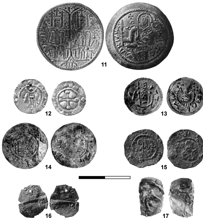
Obr. 2. Mince z archeologického výzkumu ÚAM FF MU v poloze Kostice – Zadní hrůd. 11 – inv. č. 10709, Béla III. (Uhry), 12 – inv. č. 6002, Ota I. Sličný (Morava), 13 – inv. č. 3265, Ota I. Sličný (Morava), 14 – inv. č. 4849, Svatopluk (Morava, Olomoucko), 15 – inv. č. 7334, nepřidělený (Morava, 70.–90. léta 12. stol.), 16 – inv. č. 12549, mince? (Morava?), 17 – inv. č. 12564, Leopold V. (Rakousko).

Fig. 2. Coins from the archaeological excavation at the Kostice – Zadní hrůd site. 11 – inv. no. 10709, Béla III (Hungary); 12 – inv. no. 6002, Otto I of Olomouc (Moravia); 13 – inv. no. 3265, Otto I of Olomouc (Moravia); 14 – inv. no. 4849, Svatopluk (Moravia, Olomouc region); 15 – inv. no. 7334, unidentified (Moravia, 1170s-1190s); 16 – inv. no. 12549, coin? (Moravia?); 17 – inv. no. 12564, Leopold V (Austria).