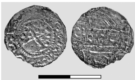
Obr. 6. Kostice – Zadní hrůd. Nález z archeologického výzkumu. Imitativní denár (Čechy?, Bavorsko?, Morava?, před r. 976).

Fig. 5. Kostice – Zadní hrůd. Find from archaeological excavation. Denarius of Henry II the Wrangler. Hahn 15a type.