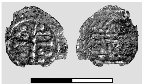
Obr. 5. Kostice – Zadní hrůd. Nález z archeologického výzkumu. Denár Jindřicha II. Svárlivý. Typ Hahn 15a.

Fig. 4. Kostice – Zadní hrůd. Find made by metal detector. Denarius of Otto of Swabia (Bavaria). Unknown type.