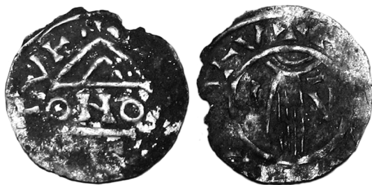
Obr. 7. Kostice – Zadní hrúd. Nález detektorem kovů. Blíže neurčený obol z konce 10. stol., průměr 17,0 mm. Čechy?, Morava? Cach 170.

Fig. 7. Kostice – Zadní hrúd. Find made by metal detector. Unidentified obol from the end of the 10 th century. Diameter 17.0 mm. Bohemia?, Moravia? Cach 170.