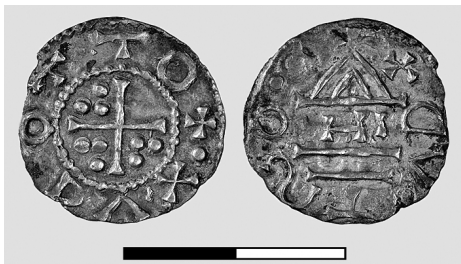
Obr. 4. Kostice – Zadní hrůd. Nález detektorem kovů. Denár Oto Švábský (Bavorsko). Neznámý typ.

Fig. 3. Kostice – Zadní hrůd. Find made by metal detector. Denarius of Henry II. the Wrangler (Bavaria). Hahn 15a or 16a type.