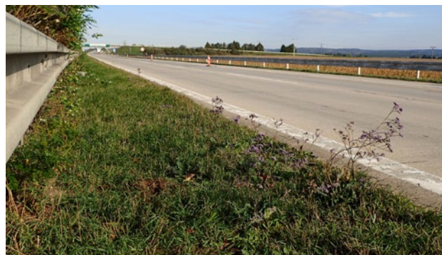
Obr. 3. Limonka Gmelinova ( Limonium gmelinii) ve středním dělicím pásu na dálnici D2 u Rakvic (37,0–36,5 km), 20. 9. 2015.

Vegetace středního dělicího pásu se nejméně jednou ročně seče, avšak v různých letech může být počet sečí i jejich ter-