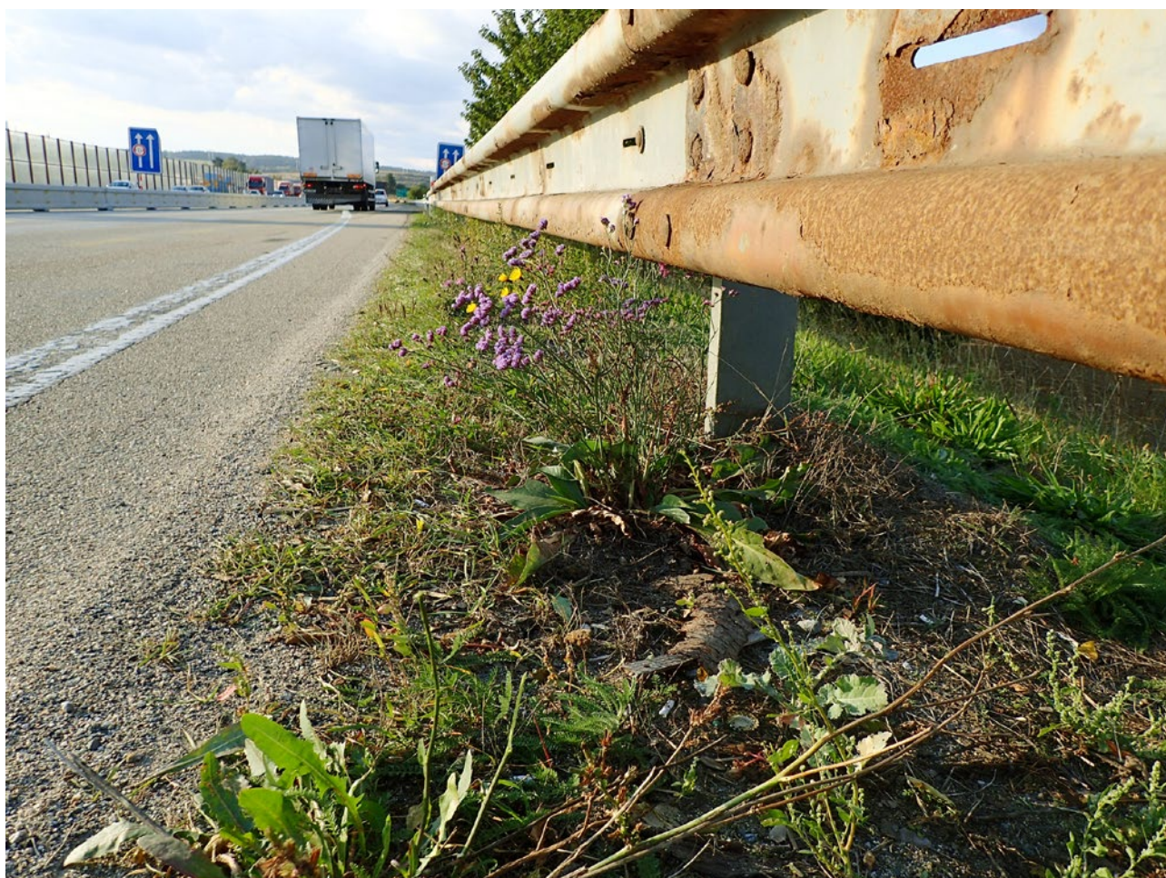
Obr. 2. Limonka Gmelinova ( Limonium gmelinii) na krajnici dálnice D1 u Ostrovačic (178,5–178,0 km), 29. 9. 2015.