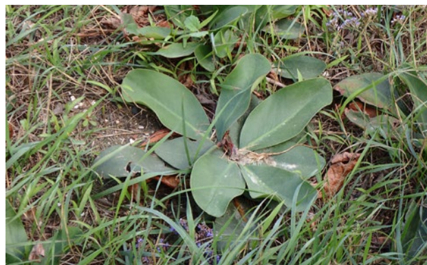
Obr. 4. Přízemní listy limonky Gmelinovy ( Limonium gmelinii) jsou sečí vegetace středního dělicího pásu dotčeny jen málo; dálnice D2 u Rakvic (37,0–36,5 km), 12. 9. 2015.

Fig. 3. Limonium gmelinii in the central reservation of the D2 motorway near Rakvice (37.0–36.5 km), 20 September 2015.