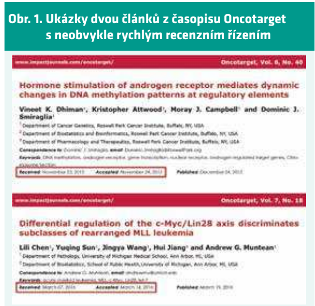
Obr. 1. Ukázky dvou článků z časopisu Oncotarget s neobvykle rychlým recenzním řízením

uautor tohoto článku [1]. Ve snaze přilákat potenciální autory k publikování editor časopisu International Journal of Educational Policy Research and Review požádal Kra-