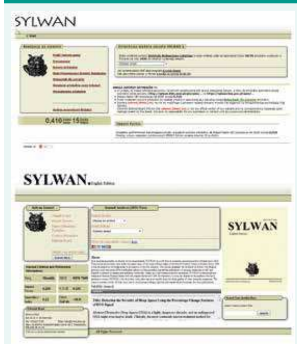
Obr. 4. Nahoře web skutečného časopisu Sylwan, dole web jeho predátorského protějšku