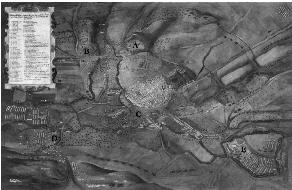
Abb. 2. Vedute von H. B. Beyer und H. J. Zeiser aus der Mitte des 17. Jahrhunderts mit der Darstellung der schwedischen Belagerung Brünns am 3. Mai 1645 (Museum der Stadt Brünn, Inventarnummer 2284). Die Vedute zeigt das historische Fluss- und Kommunikationsnetz von Südosten: A – Staré Brno (Altbrünn), das linke Schwarza-Ufer, B – Staré Brno, das rechte Schwarza-Ufer, C – Dornych, D – Benediktinerkloster in Komárov, E – Prämonstratenserkloster in Zábřovice.

beiden Gruben in Überschneidung mit einer älteren, ebenfalls jungburgwallzeitlichen Grube befand. Außerdem weisen knöcherne Gegenstände und eine „Bürste“ (ZAPLETALOVÁ im Druck), die an dem an der Ecke der Straßen Vojtova und Grmelova gelegenen Fundort entdeckt wurden, noch darauf hin, dass dort Textilien hergestellt wurden. Leider lässt sich im Nachhinein nicht mehr feststellen, ob diese Funde der älteren oder der jüngeren Siedlungsphase zuzuordnen sind.