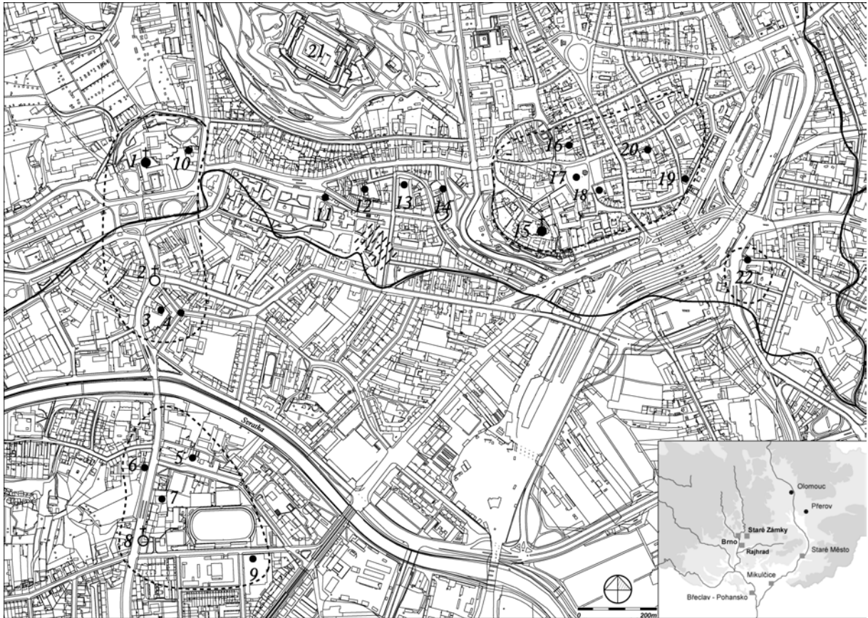
Abb. 1. Staré Brno, Vorlokationsbesiedlung der Stadt Brno und die damit zusammenhängenden Fundstätten mit Bezeichnung der historischen Wasserläufe (Svatka-Mühlbach, Svitava-Mühlbach und Ponávka). 1 – frühmittelalterliche Marienrotunde mit dem Begräbnisareal, 2 – frühmittelalterliche Funde vor der Entstehung der hochmittelalterlichen Prokopiuskirche, 3, 4 – Funde der Feuerzerstörung der Holz-Erde-Befestigung, 5 – Kloster und Krankenhaus der Barmherzigen Brüder, 6- jungburgwallzeitliche Gräber, 7 – Videňská Nr. 15 mit Umgebung, 8 – Wenzelskiche, unbekanntes Alter, 9 – Funde aus der Feldgasse (Vojtova/Grmelova Gasse), 10 – Orlovna, 11 – St.-Anna-Krankenhaus (Fund des Ofens); 12 – Lochenberg, 13 – Haus Zu den sieben Schwaben, 14 – westlicher Hang des Petersberges (das Feuchtgelände schraffiert), 15 – Peterskirche, 16 – Altes Rathaus, 17 – Krautmarkt, 18 – Theater Redoute, 19 – Josefská Gasse Nr. 7-9, 20 – Orlí Gasse Nr. 10, 21 – hochmittelalterliche königliche Burg Špilberk (Spielberg), 22 – Dornych. Der vorausgesetzte Umfang der frühmittelalterlichen Besiedlung ist durch gestrichelte Linien abgegrenzt.

das archäologische Gelände unter dem Großteil des ursprünglichen inneren Klosterareals ähnlich darstellte. Für diese Situation sprechen auch die Ergebnisse der neuesten Forschung (UNGER/KOS 2002, 292-294), bei der es außerdem erstmals gelang, die Besiedlung aus der jüngeren Burgwallzeit zu erfassen – und zwar nicht unter dem mittelalterlichen Kloster, sondern anstelle des heutigen Haupttors zum Kloster. 4 Probleme ergeben