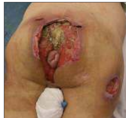
Obr. 7. Rozsáhlý sakrogluteální dekubitus. Fig. 7. Extensive sacrogluteal decubitus (pressure ulcer).

1. European Pressure Ulcer Advisory Panel and National Pressure Ulcer Advisory Panel. Treatment of pressure ulcers: Quick Reference Guide. Washington DC: National Pressure Ulcer Advisory Panel 2009.