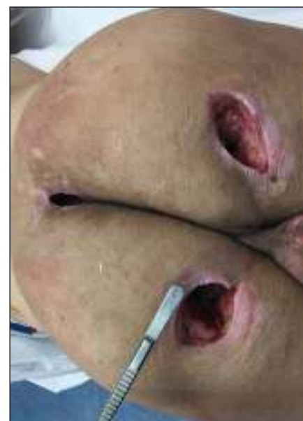
Obr. 5. Stav po nekrektomii sakrálního a obou ischiadických dekubitů.

Fig. 4. Fistula of the left ischiadic (sciatic) pressure ulcer, sacral decubitus (pressure ulcer).