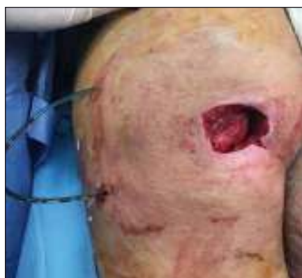
Obr. 6. Transpozice distální porce m. gluteus maximus nad tuber ischiadicum.

Fig. 5. Condition after necrectomy of sacral and both sciatic decubitus (pressure ulcers).