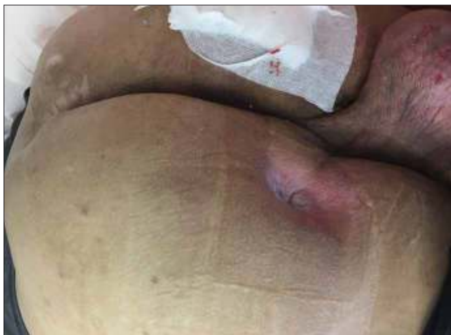
Obr. 4. Píštěl ischiadického dekubitu vlevo, sakrální dekubitus.

Ischiadické dekubity jsou nejčastější u pacientů připoutaných na invalidní vozík a velmi hojně se vyskytují ve formě píštělí. V takovém případě může být na kůži patrný defekt jen několik mm, jako je tomu u našeho pacienta (obr. 4, 5), ale v podkoží se zpravidla nachází několikacentimetrová kapsa (přičemž píštěle mohou komunikovat s jinými orgány). Z toho důvodu je nezbytné důsledné dovyšetření terénu defektu i okolní tkáně. Pokud je lytický tuber