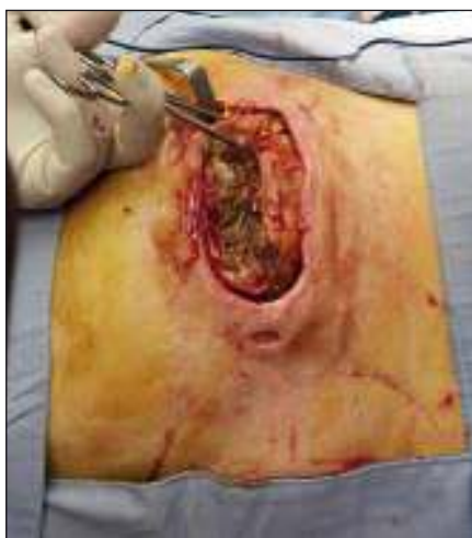
Obr. 1. Trochanterický dekubitus s pseudocystou.

Fig. 1. Trochanteric decubitus (pressure ulcer) with pseudocyst.