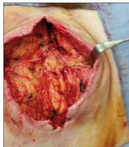
Obr. 3. Obrázek dekubitu po nekrektomii.

Fig. 2. Extirpation of pseudocyst of decubitus (pressure ulcer).