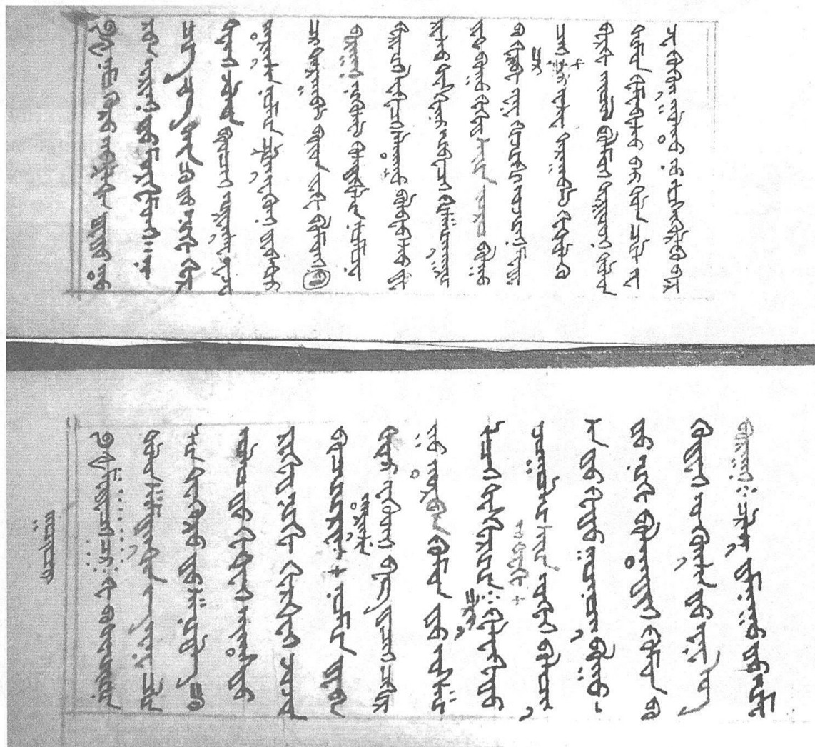
С. Наадгайн өөрийн бичсэн гар бичмэлээс