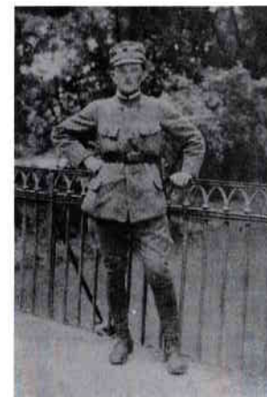
Obrázek 10 – Domobranec z Itálie ve strážnickém zámeckém parku 58