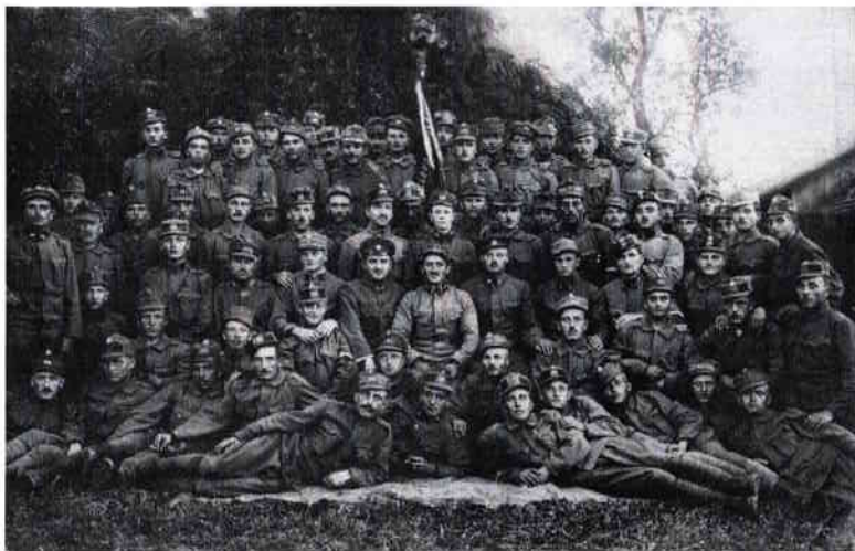
Obrázek 21 – Vojáci 104. pěšího pluku 87

Strážnice si na čas vyzkoušela, jaké to je být posádkovým městem. Kasárna ve městě však nevyrostla a vojáci se stěhovali jinam. Zůstává otázkou, jestli by občané města o vojenskou posádku stáli. Přineslo by to jistě řadu problémů, které by patrně zvýšení prestiže města nevyvážilo. Ve městě v meziválečném období udržovali pořádek jen policisté a četníci a vojenské jednotky se do města dostávaly jen v době cvičení (tzv. manévřů) a mobilizace v roce 1938.