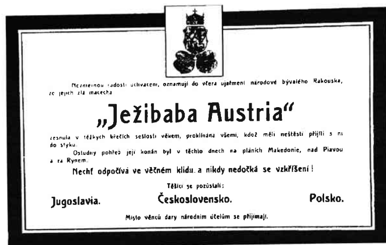
Obrázek 5 – Dobové humoristické parte Rakouska-Uherska 21