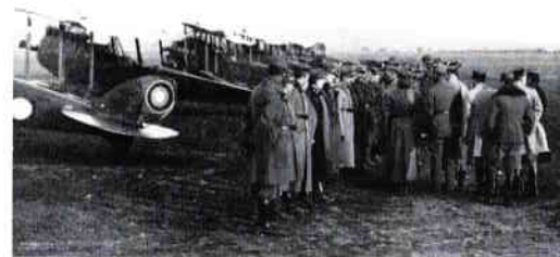
Obrázek 19 – Polní letiště nedaleko Strážnice v roce 1919 80

stupněm A (nejlepší zdravotní způsobilost). 77 Následkem vzniklé situace a díky své geografické poloze se Strážnice dočasně stala posádkovým městem. V červnu přijelo do města na 300 vojáků, kteří se ubytovali ve školách. Leopold Nopp tuto skutečnost komentoval: „Pro příchod vojska byl unáhlený konec školního roku. Dne 21/6 přišlo asi 300 mužů 81. pěšího pluku a zabrali novou školní budovu tak rychle, že učitelé obecné školy chlapecké, která byla umístěna kvůli úspoře topiva již 4. rok v přízemí, museli shromáždit žáky na dvoře a tam jim narychlo rozdali školní zprávy. – V I. a II. patře mohli učitelé s začtvem ještě ten den zůstat, ale v neděli přišlo opět asi 300 mužů a obsadili ostatek.“ 78 Armáda usurpovala školní budovy i nadále. „Vojsko bylo brzy po celém městě. Bylo ubytováno i v chlapecké obecné škole u kostela, v gymnasiu, v katolickém spolku, ve dvoře, v zámku.“ Na zámku byla dokonce umístěna poddůstojnická škola. Celkem se jednalo o více než 2000 mužů 8. divize domácího vojska z formujícího se sboru generála Aloise Podhajského. 79