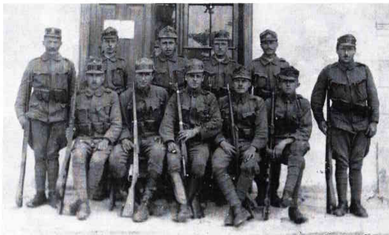
Obrázek 18 – Vojáci 81. pěšího pluku ve Strážnici v roce 1917 76

tam přestrojen za obchodníka se zeleninou, ale nic nevyzvěděl. Nakonec se za tento neúspěch dostal před polní soud. Po začátku první světové války musel narukovat k 3. pěšímu pluku a s ním na frontu, kde prodělal boje na srbském, ruském i italském válčišti. V Itálii byl zraněn na Monte San Gabriele. Ze zranění se léčil i v rekonvalescentu umístěném na zámku ve Strážnici. Po 12. listopadu 1918 se přihlásil do služeb Slovácké brigády a v jejích řadách se účastnil obsazování pohraničních území jihu Moravy. Byl zařazen u štábní setniny a posléze u 3. setniny I. polního praporu a také u 4. setniny téhož praporu (zprvu v hodnosti desátníka a později četaře).