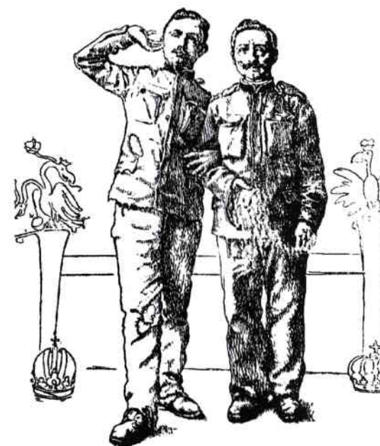
Kamarádů z mokré čtvrti.

Obrázek 4 – Dobová karikatura znázorňující císaře Viléma a Karla jako potměšilé opilce 18