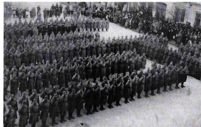
Obrázek 12 – Přísaha Slovácké brigády v Hodoníně 61

Poté, co dostal zmocňovací dekret k vytvoření Slovácké brigády od vojenského odboru Národního výboru v Brně (konkrétně od Jaroslava Stránského), začal 5. listopadu 1918 svolávat důstojníky a mužstvo z Hodonínska i okolních okresů. Také do Strážnice přišla 8. listopadu zpráva z hodonínského okresního hejtmanství: „Dobrovolníci, kteří se hlásí k národní obranné strážní službě, mají se ihned dostavit na vojenské staniční velitelství do Hodonína. Tato akce je velmi vážná a nutná k udržení pořádku.“ 60