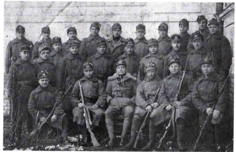
Obrázek 13 – Vojáci Slovácké brigády 63