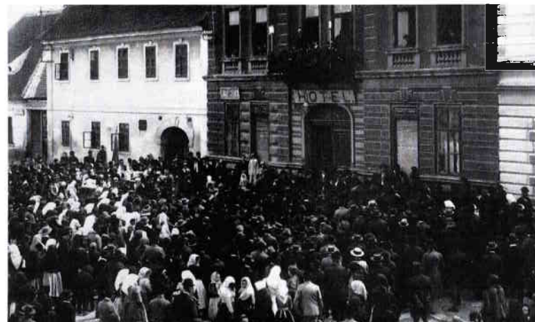
Obrázek 15 – Oslavy 1. května 1919, během druhého tábora lidu řeční z balkonu soc. dem. poslanec Koutný z Hodonína 69