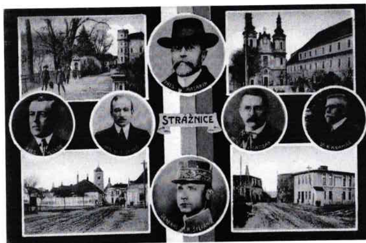
Obrázek 3 – Dobová pohlednice znázorňující klíčové osobnosti vzniku samostatného Československa ve spojení s motivy Strážnice. 16