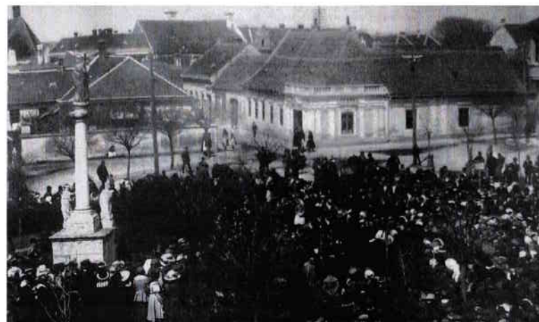
Obrázek 16 – Sazení lípy svobody 1. května 1919 70