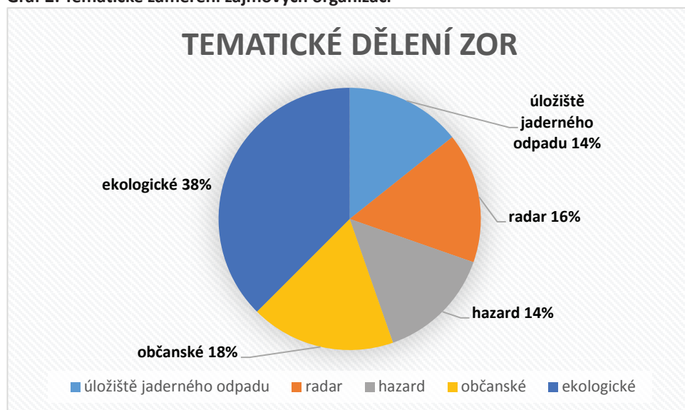
Graf 2: Tematické zaměření zájmových organizací