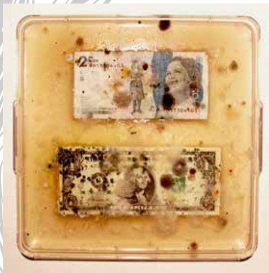
Ken Rinaldo, Borderless Bacteria; Colonialist Cash . Bioart Lab School for Visual Arts, New York, Mexico City, Lisbon, Berlin 2017. Výstava ve čtyřech městech na pozvání Marty de Menees a Manuela Furtada dos Santos. © Ken Rinaldo.