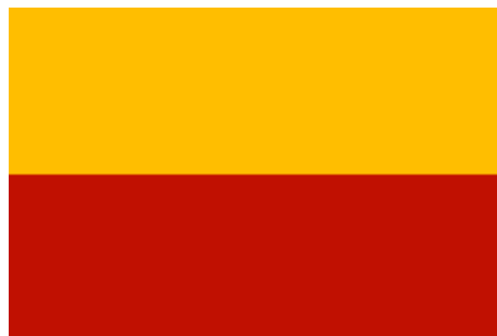
Moravská vlajka žlutočervená