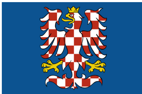
Moravská vlajka heraldická