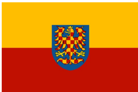
Moravská vlajka žutočervená se znakem