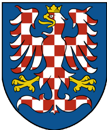
Znak Moravy užívaný dnes