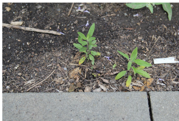
Obr. 6. Semenáče ořechokřídlece klandonského ( Caryopteris ×clandonensis) v okrasných záhonech vedle pěstovaných jedinců. Brno-Bohunice, Palachovo náměstí, 2. 9. 2020