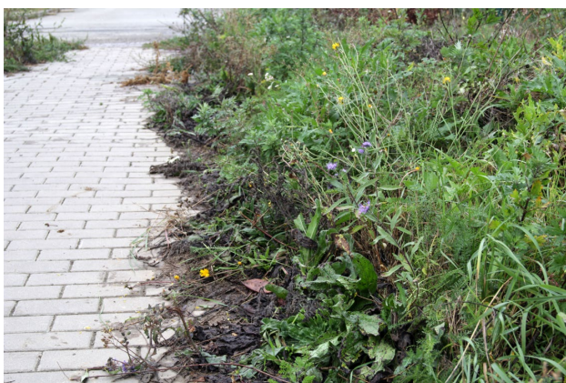
Obr. 5. Biotop ořechokřídlece klandonského ( Caryopteris ×clandonensis) v Rozdrojovicích v okrese Brno-venkov, 5. 10. 2019

Fig. 4. A specimen of Caryopteris ×clandonensis escaped from cultivation in Rozdrojovice, distr. Brno-venkov, 5 October 2019