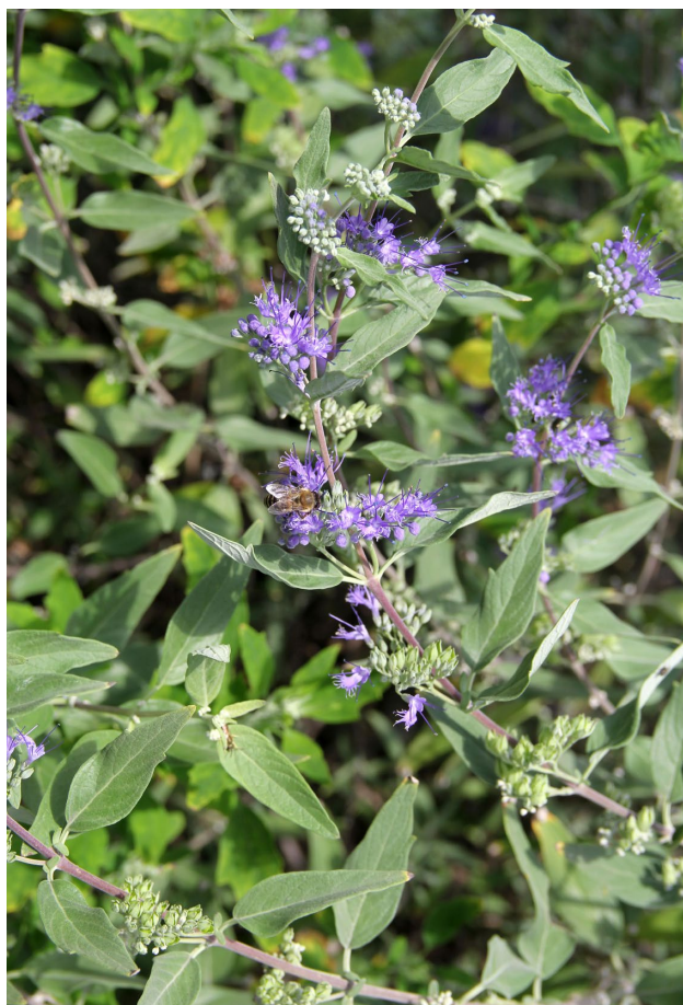
Obr. 1. Ořechokřídlec klandonský ( Caryopteris ×clandonensis), kvetoucí výhon. Brno-Bohunice, Palachovo náměstí, 2. 9. 2020