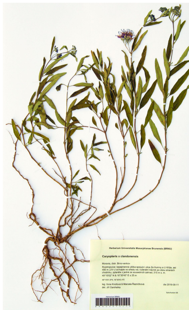
Obr. 3. Herbářový doklad zplanělého výskytu ořechokřídlece klandonského ( Caryopteris ×clandonensis ) v Rozdrojovicích v okrese Brno-venkov (I. Knollová et M. Řezníčková 2019 BRNU 673170)

Místo nálezů se nachází na jižním okraji vsi v uličce, která vznikla s výstavbou rodinných domků těsně po roce 2000. Na leteckém snímku z roku 2003 na serveru mapy.cz nestojí ještě všechny domy na jihovýchodní straně ulice Za Humny a domy po obou stranách spojovací uličky vypadají jako čerstvě postavené a nemají ještě upravené zahrady. Uličkou dnes vede dlážděný chodník, který lemují ruderální trávník. Dne 5. října 2019 tam první autor této zprávy zaznamenal