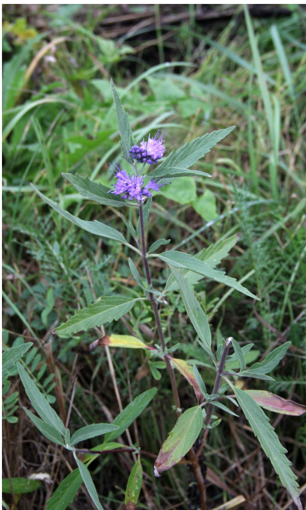
Obr. 4. Zplanělý jedinec ořechokřídlece klandonského ( Caryopteris ×clandonensis) v Rozdrojovicích v okrese Brno-venkov, 5. 10. 2019

Fig. 4. A specimen of Caryopteris ×clandonensis escaped from cultivation in Rozdrojovice, distr. Brno-venkov, 5 October 2019