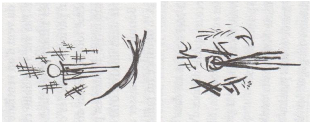
FIG. 2 : Les dessins

Fragmentaires, les éléments de l'intrigue se mettent ainsi en place à travers les trois registres discursifs différents de l'incipit et qui s'avèreront convergents. Nikki tente d'élucider des assassinats d'animaux, de plus en plus osés et sadiques – animal en peluche, écureuil, raton laveur, chien. Sur les lieux du crime, elle trouve à chaque fois des dessins étranges, à chaque fois modifiés, d'une silhouette dansante : c'est la même qui apparaît non seulement dans ses rêves répétés, mais aussi sur l'écran de son VHS.