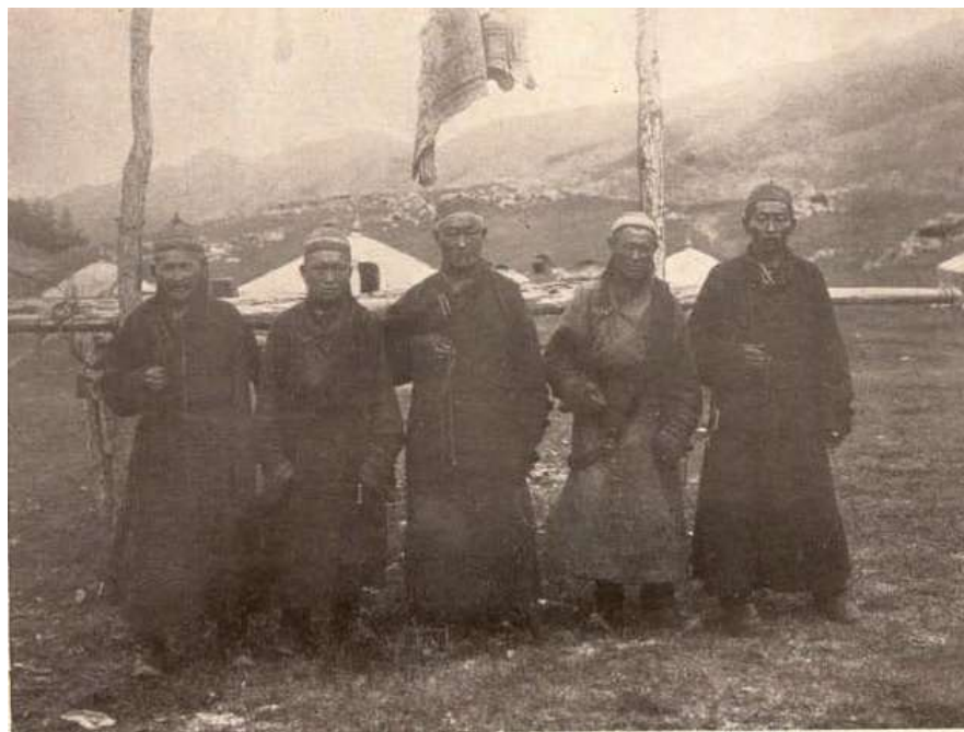
1906 онд Алтайн Урианхайн Баруун Амбаны хүрээний лам нар (В.В.Сапожниковын зураг)