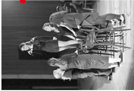
INTIMNÝ ZEMEPIS ŽENY (Divadlo Paradox)