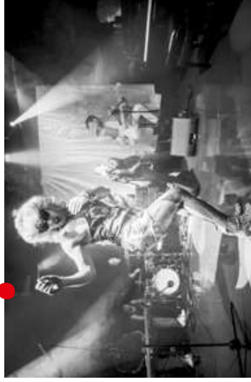
HEDWIG A JEŠŤ ANGRY INCH (Freedom Production)

aj o náročnom a rýchlom odchode z domova. Spochybňujú vlastné rozhodnutie, svoju identitu, hľadajú domov skrz nájdenie jedna druhého.