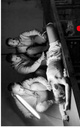
POKLAD ARKÁDIE (Ensemble Damian)

Otázka transrodovosti naznačená v Zlomi jelenovi sa odvíja v celistvom príbehu o živote Hedwig a jej Angry Inch . Muzikál z konca deväťdesiatych