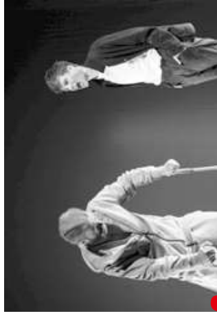
KDO ZABIL MÉHO OTCE (Depresívni deti touží po penězích)

a tá Čermáková funguje ako „ekoteroristická hororová komédia s detektívnou zápletkou“ 3 . Inscenácia našťudovaná s umeleckým „gangom“ Depresívni deti touží po penězích maia od prvej minúty tempo tikajúcej bomby pevne ukotvené v pôvodnom dejí. Rozuzľovanie otázky, kto zabil jeleňa, sa postupne stáva druhoradým. Idylický český les je zmenený na veľké skladištko plastu a jednej opustenej chladničky. Chladnička je patrične reusée ako skrýša – Ivana? Ivany? [Je to jedno!], Na pohľavi nezáleží!“, opakovane sa ozýva priestorom. Depresívni deti si textovú zložku interpretujú svojsky, v texte nachádzajú aktuálne environmentálne témy, genderové otázky a ponechávajú vyznieť pôvodnú Klicperovu češtinu. Obyčajný človek sa má zbaviť predsudkov, veď predsa, v lese sme si všetci rovni... (a aj mimo neho). V A4-ke sa „gang“ predstavil druhýkrát v tragickvej monodráme Kdo zabil mého otca . V osobnej spovedi