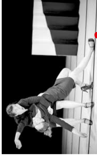
SAME SAME (Divadlo Ponoc)

Postupne sa vyvíja medzi ženami vzťah a spojenie v závere dáva jasný „matčkin“ Choreografka Karine