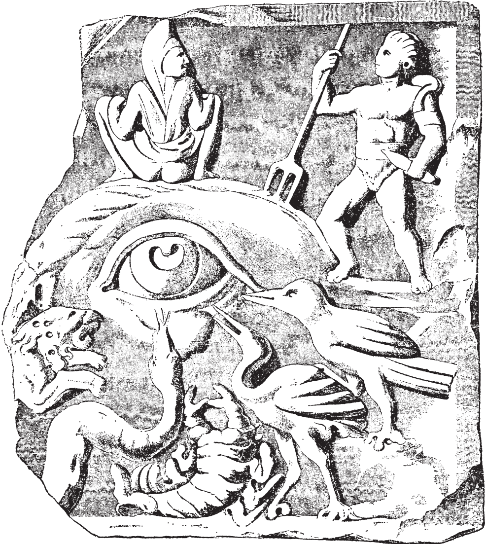
Abb. 2 Fragment von einem Steinrelief in den Sammlungen von Woburn Abbey (Großbritannien). Ein „böses/vielleidendes Auge“ angegriffen von Gladiator ( Retiarius ) mit Dreizack, Krähe, Kranich, Skorpion, Schlange und Löwe; auf dem Auge hockt ein Mann, als wolle er es beschmutzen. Nach Engemann 1975 .

ein außenstehender Beobachter wusste oft nicht, was er darüber überhaupt denken sollte. 14 Das alles hat dazu beigetragen, dass sie sich mehr als alles andere dazu geeignet haben, den Bösen Blick eines Menschen oder eines anderen Wesens auf sich zu ziehen und damit auch unschädlich zu machen.