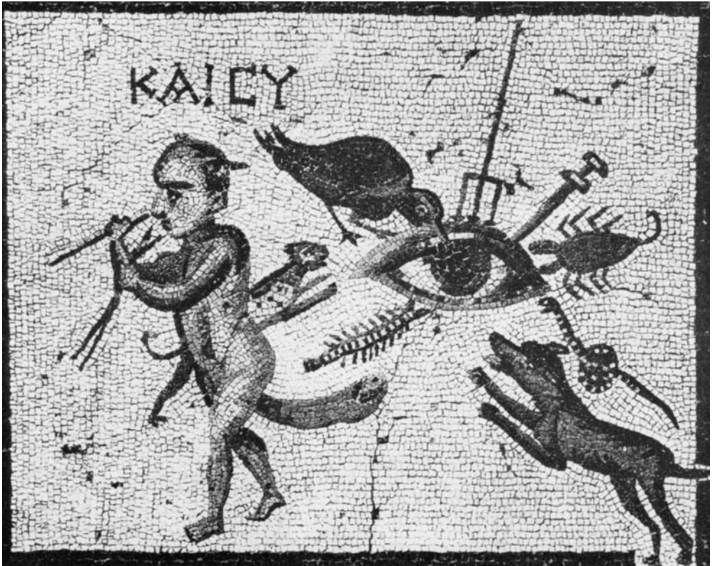
Abb. 3 Bodenmosaik aus Jekmejh bei Antiochia (Türkei). Ein „böses/vielleidendes Auge“ angegriffen von Panther, Vogel, Dreizack, Schwert, Skorpion, Schlange, Hund und Tausendfüßler; gegen das Auge ist auch der Phallus von einem Zwerg gerichtet, der sonst mit dem Rücken zugewandt ist und Zaubergefälle in seiner Hand hält. Nach Engemann 1975 .

Von den Archaika, die im Frühmittelalter verwendet wurden, hat A. L. Meaney (1981, 220) nur bei den gelochten römischen Münzen die Möglichkeit angedeutet, dass sie als Amulette gegen den Bösen Blick genutzt werden konnten. Meiner Meinung nach kommt ein viel breiteres Spektrum von Archaika in Frage, im Grunde alle Artefakte, die sekundär als Anhänger, sei es selbständig oder in einer Kette am Hals getragen, verwendet wurden. Eine Art magischer Wirkung hat jedoch offenbar auch ihre Verbergung (unter der Kleidung, in einem Beutel) nicht ausgeschlossen. Gerade das Beispiel der antiken Münzen weist darauf hin, wie die ganze Problematik kompliziert ist und ohne schriftliche oder ikonographische Quellen,