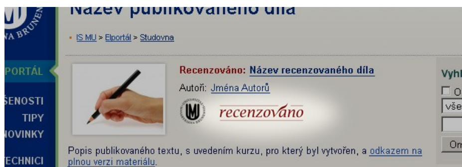
Obr. 2. Dílo označené logem recenze.