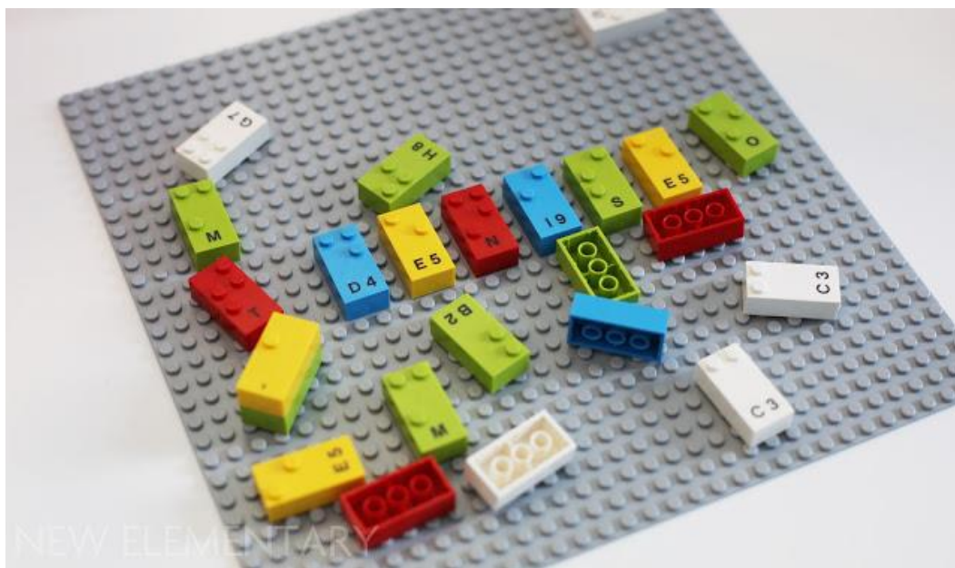
LEGO Braille Bricks (New Elementary [online])