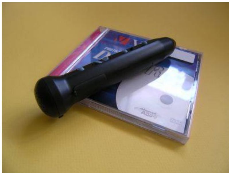
Čtečka hlasových štítků PenFriend 2 (Bubeníčková, Karásek, Pavlíček, 2019 [online])