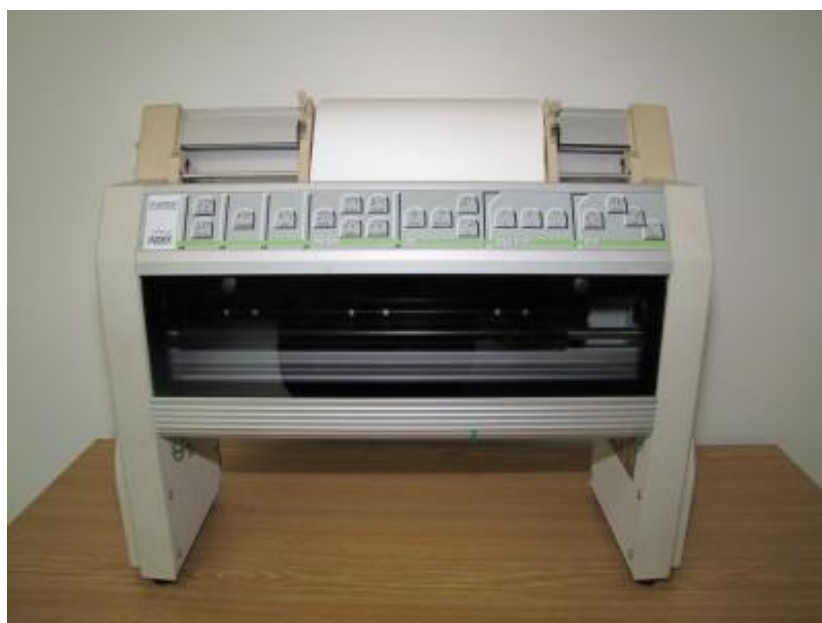
Braillská tiskárna Index Everest (Bubeníčková, Karásek, Pavlíček, 2019 [online])