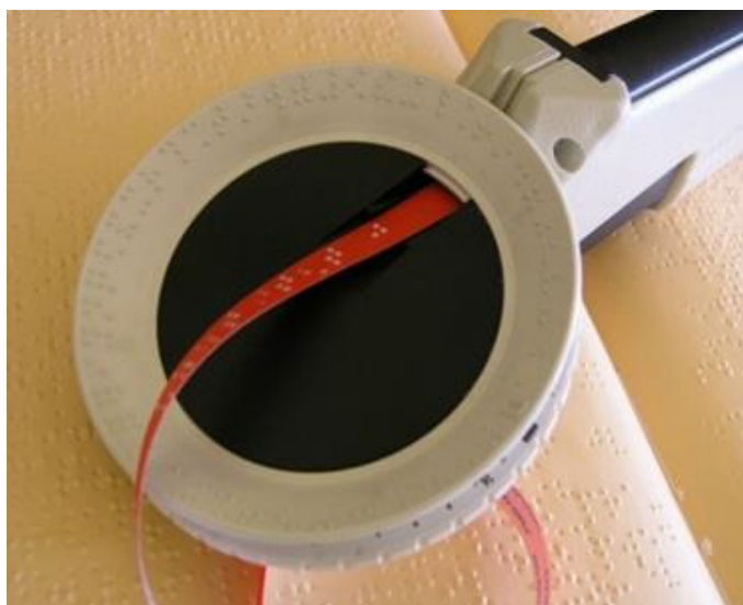
Dymokleště (Bubeníčková, Karásek, Pavlíček, 2019 [online])