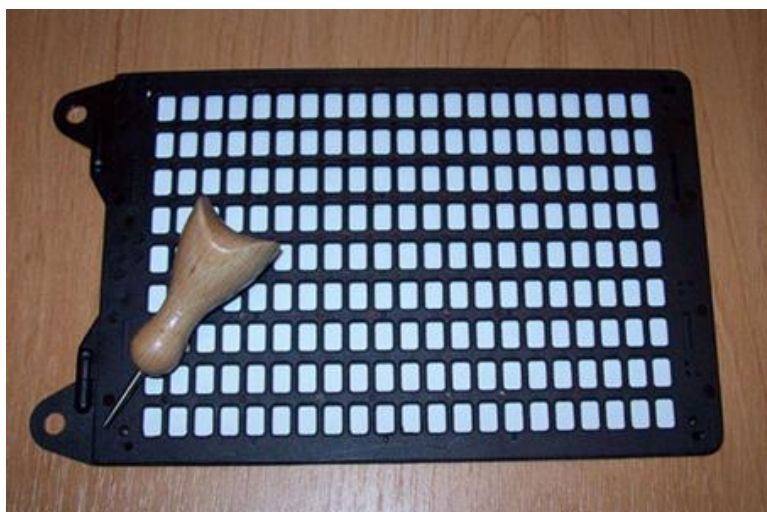
Pražská tabulka s bodátkem pro ruční psaní (Tyflokabinet České Budějovice, o.p.s. [online])