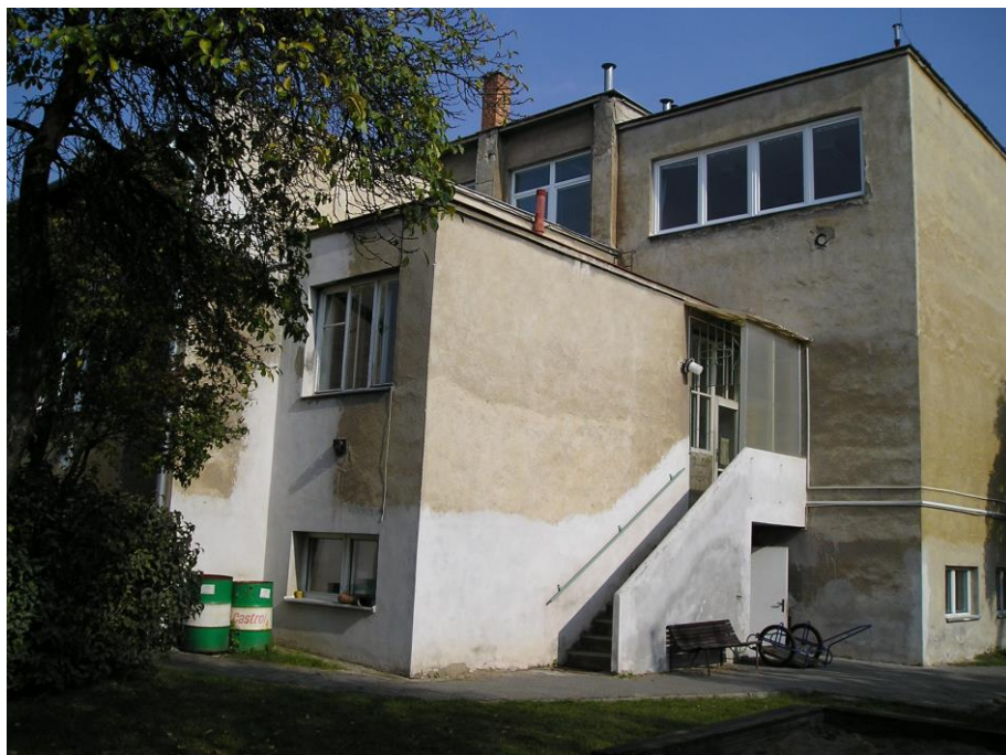
Škola – budova