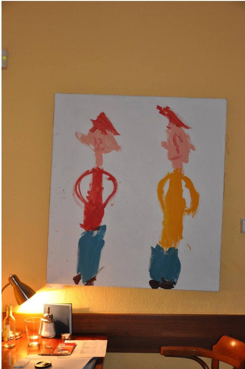
Ukázka výtvarných prací z prodejní výstavy v Café 99 - 2011