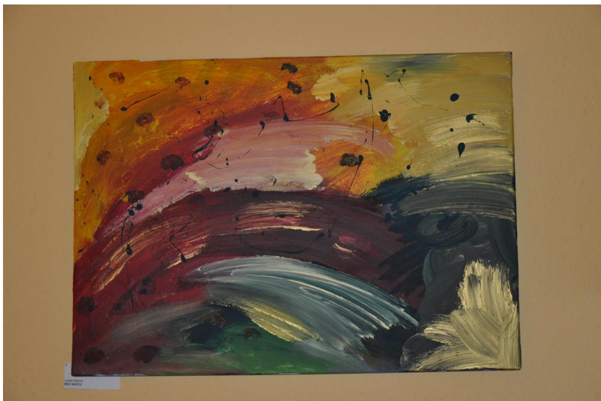
Ukázka výtvarných prací z výstavy - 2010