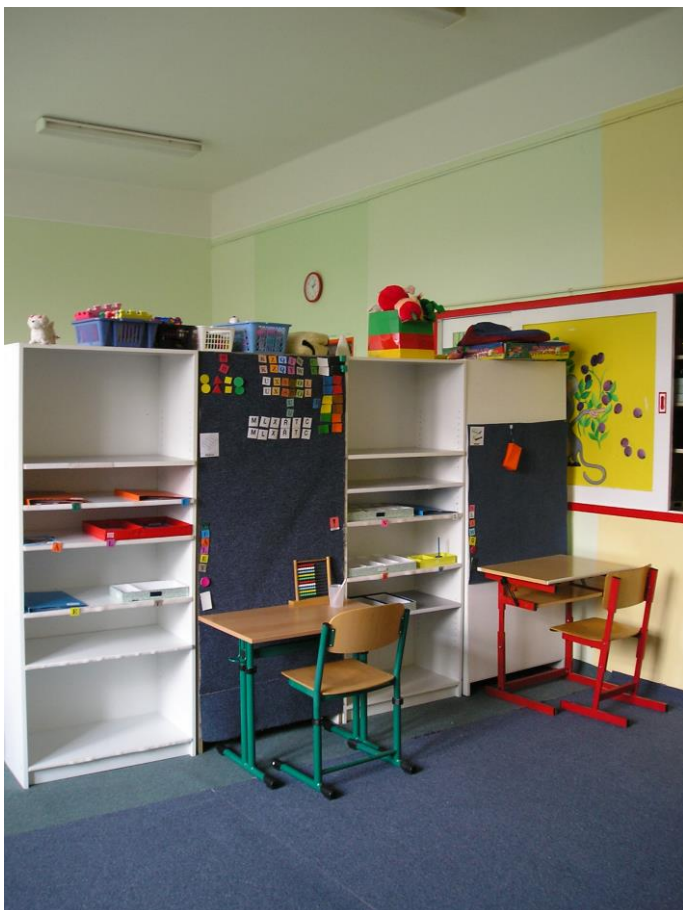
Škola – třída