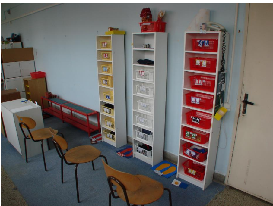
Škola - šatna