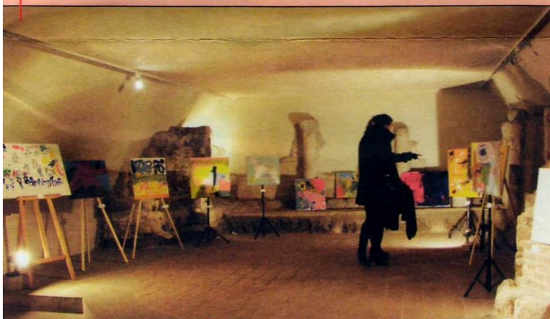
Barevné a originální, především také obrázky najdou návštěvníci na výstavě Knihovna poníků.