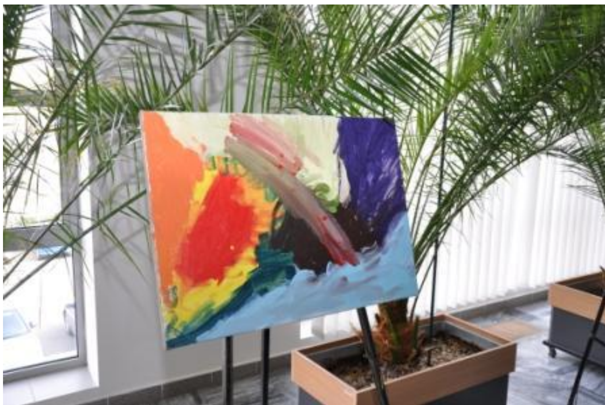
Ukázka výtvarných prací z výstavy Knihovna poníků na konferenci - 2010