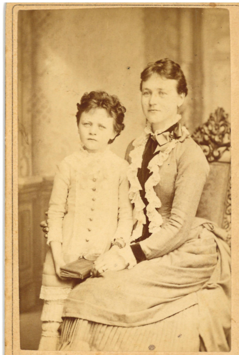
ATELIER RAFAEL BRUNN — 26 — v. BRNÉ