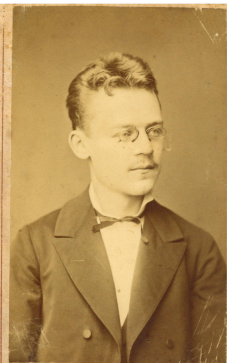
ATELIER RAFAEL Brünn — 20 — v. Brně.