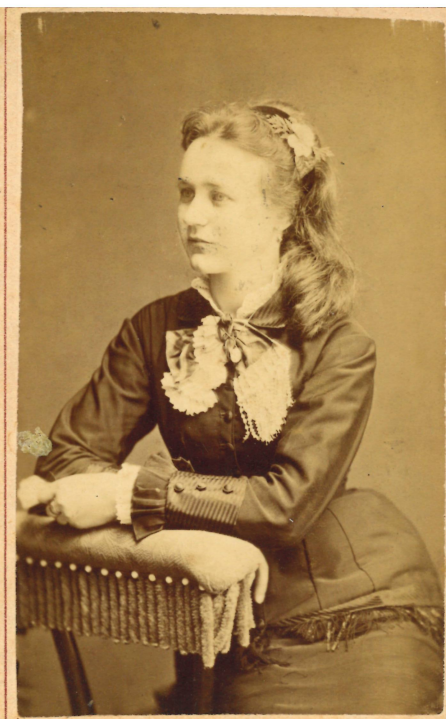
ATELIER RAFAEL Brünn —20— v. Brně.