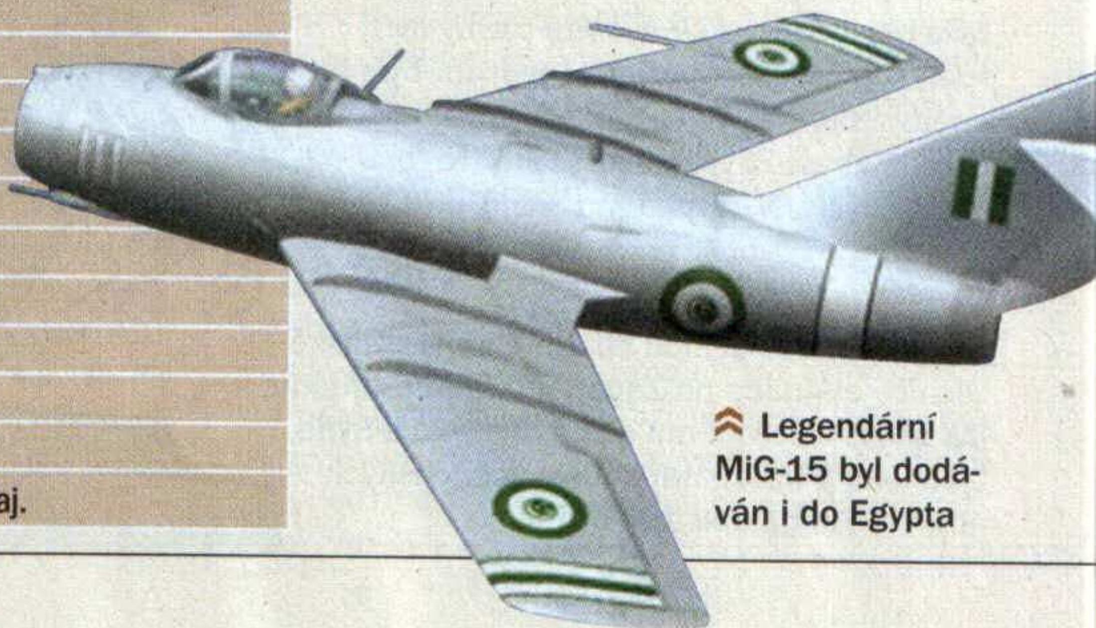
Legendární MiG-15 byl dodáván i do Egypta

dále: radiolokační stanice, transportní loď, minolovky, miny, nákladní vozidla aj.